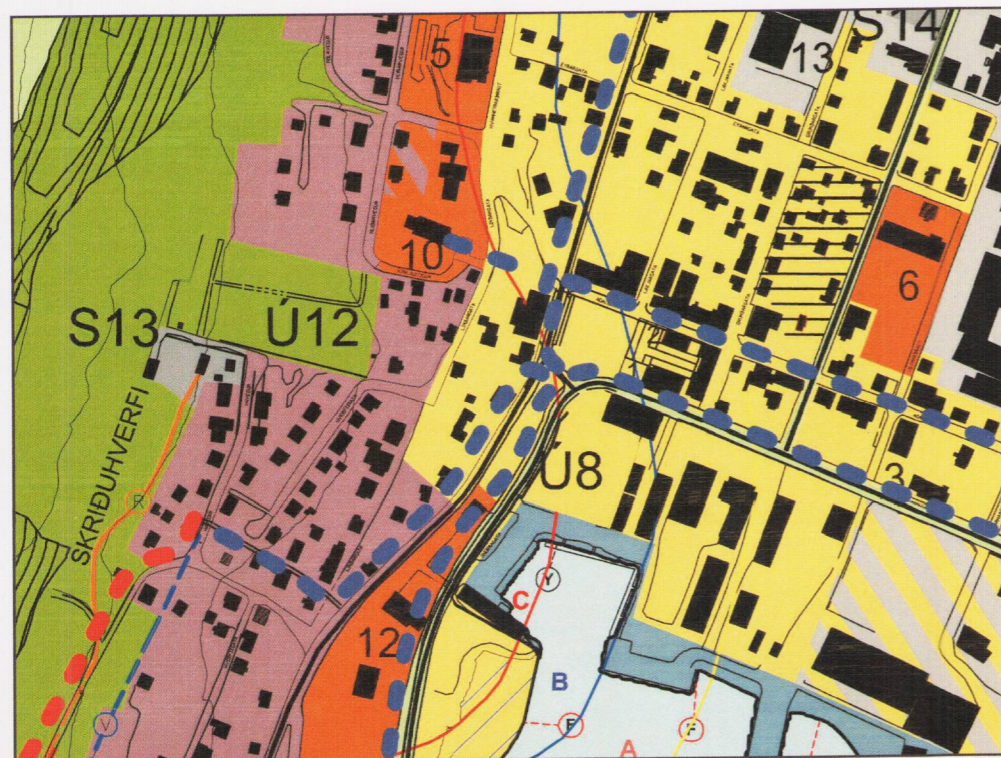
Aðalskipulag Fjallabyggðar, staðfest 22.12.2010