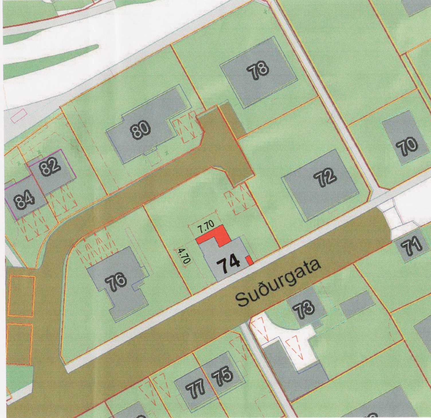
Breytt deiliskipulag við Suðurgötu 74 Mkv. 1:500

Hús nr 74 við Suðurgötu var byggt 1920 er því skylt að leita álits hjá Minjastofnun Íslands með minnst sex vikna fyrirvara ef eigendur þeirra hyggjast breyta þeim, flytja þau eða rífa (lög nr. 80/2012).