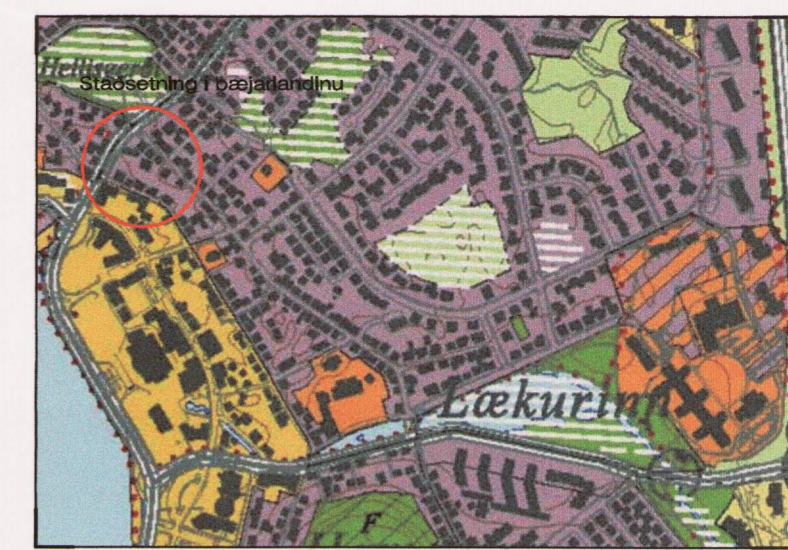
Úrdráttur úr aðalskipulagi Hafnarfjarðar

Kvöð er um aðkeyrslu að bílstæði Hverfisgötu 4b um lóðina Hverfisgötu 6b. Kvöð er um aðkeyrslu að bílskúr Hverfisgötu 6b um lóðina Hverfisgötu 4b.