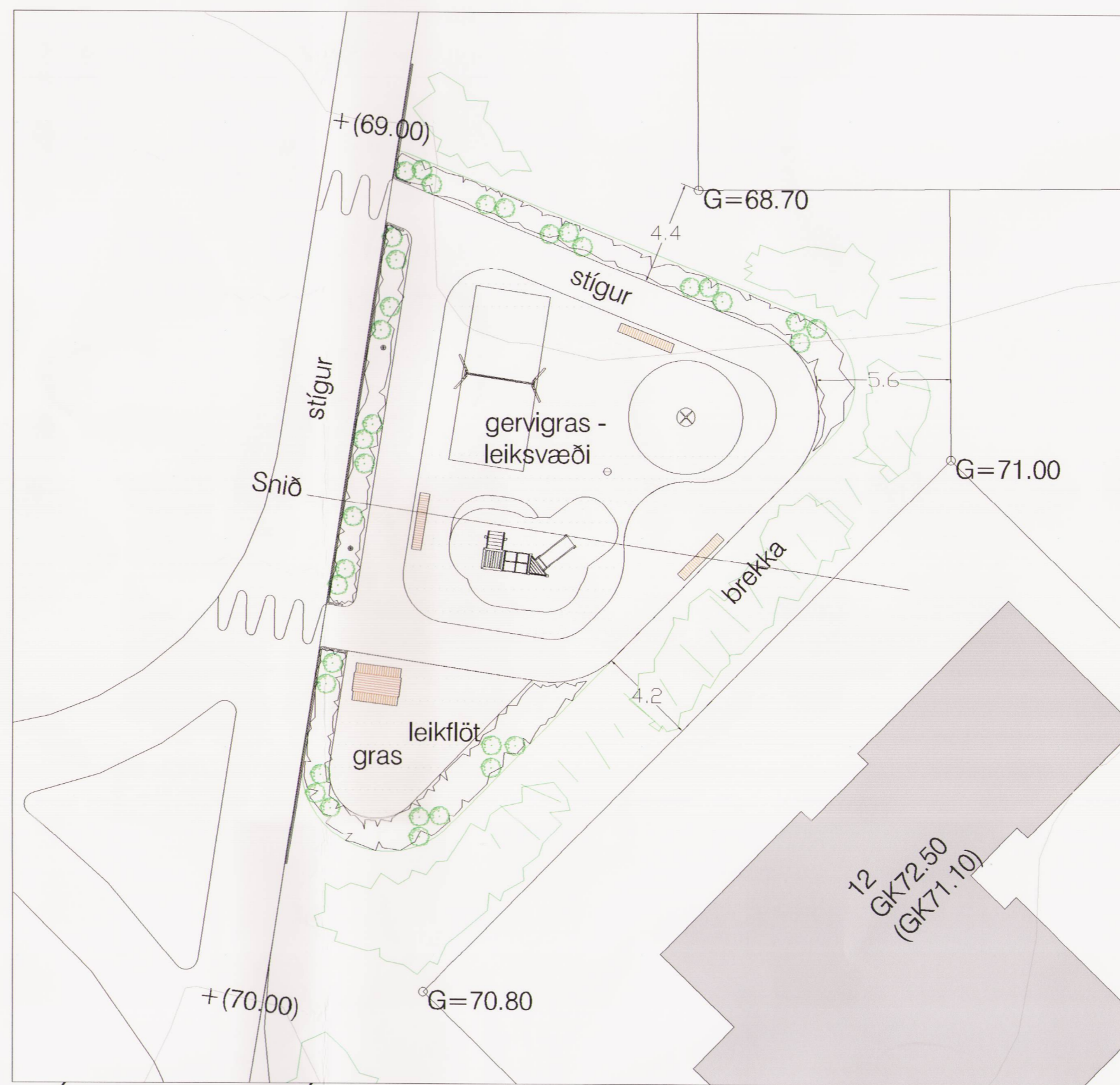
SKÝRINGARUPPDRAÐTUR MKV. 1:200 Möguleg útfærsla leiksvæðis.