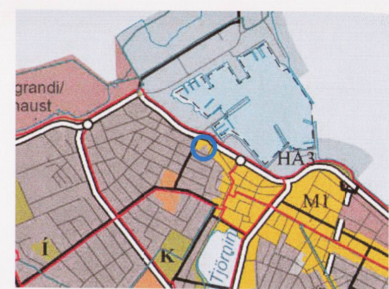
ÚR AÐALSKIPULAGI REYKJAVÍKUR 2001-2024