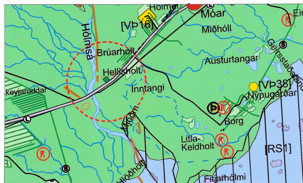
Gildandi uppdráttur í mkv. 1:50.000