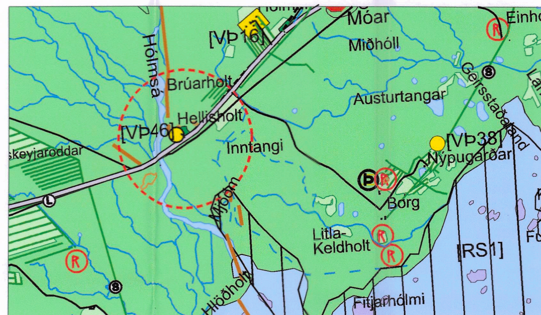
Breyttur uppdráttur í mkv. 1:50.000

„Sveitarfélagið mun í samráði við Minjastofnun Íslands vinna að skráningu fornleifa á skipulagstímabilinu. Skráning verður áfangaskipt og svæðum þar sem áform eru um mannvirkjagerð forgangsraðað fremst, t.d. þar sem áform eru um uppbyggingu miðstöðva og lykilstaða vegna ferðaþjónustu.“