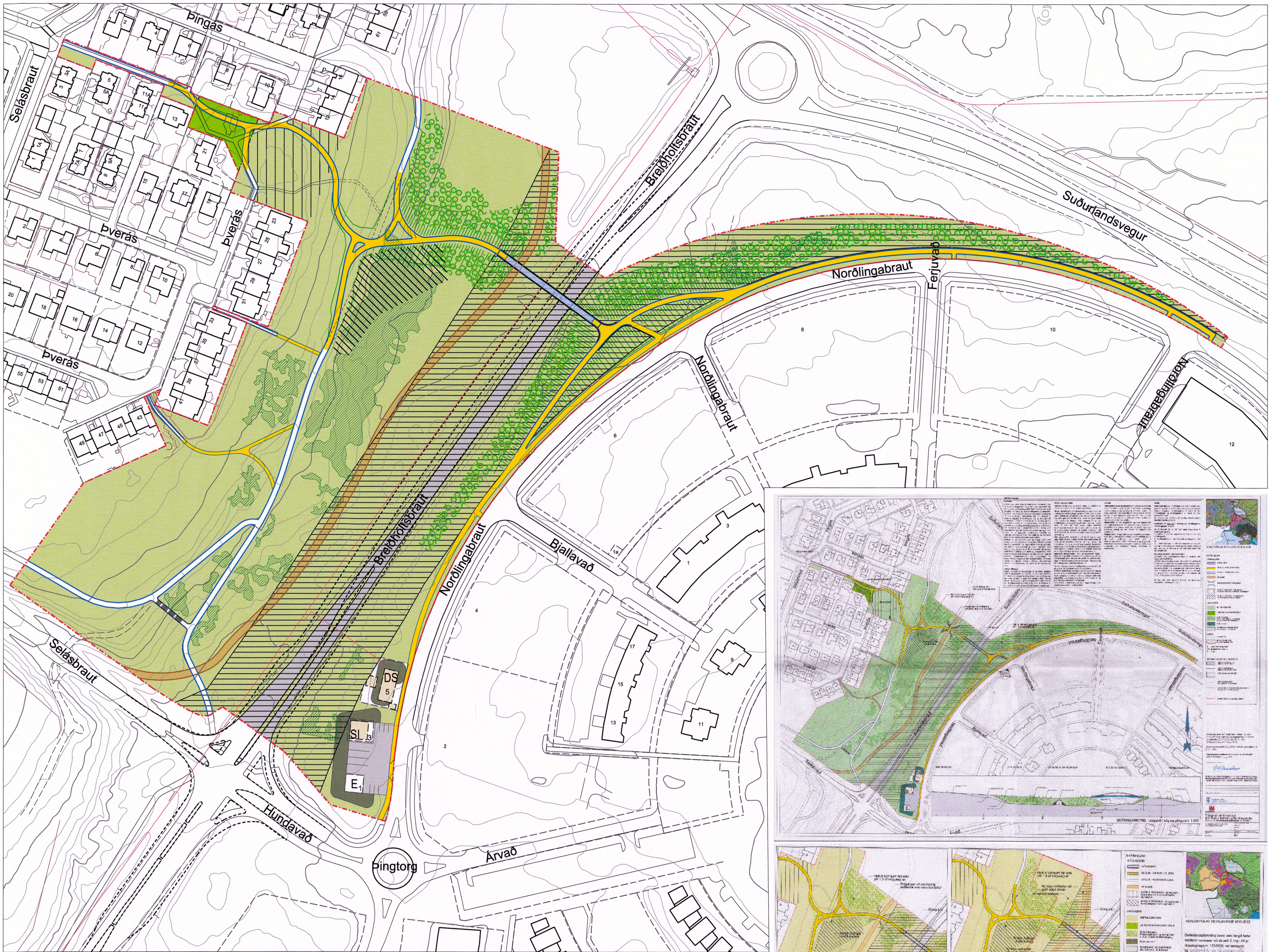
Gildandi deiliskipulag frá febrúar 2011, m.s.br.