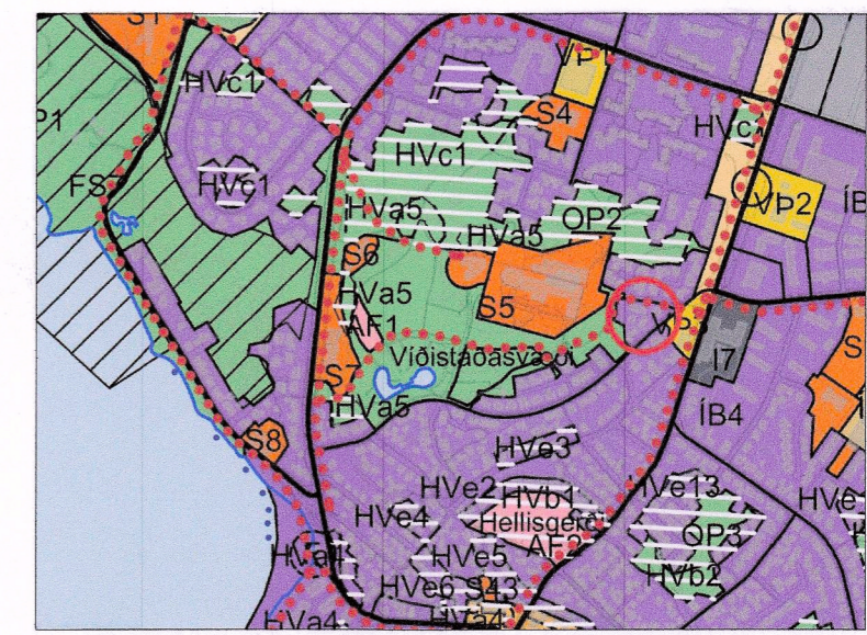
HLUTAMYND - AÐALSKIPULAG HAFNARFJARÐAR 2013 - 2025