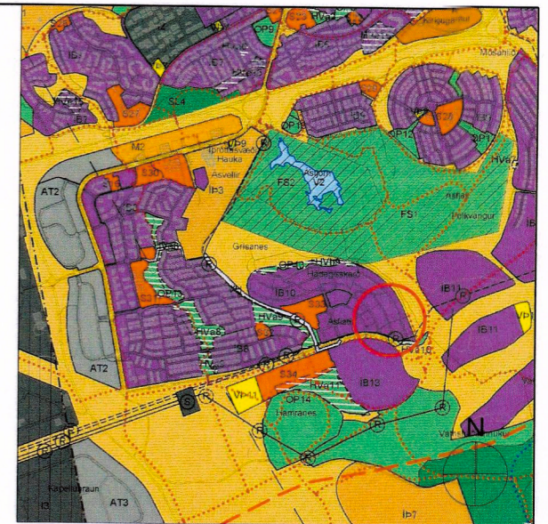
YFIRLIT – HLUTI AÐALSKIPULAGS HAFNARFJ. 2013-2025

Grunnflötur byggingarreits: 303 m 2 Hámarks byggingarmagn (Brúttó): 493 m 2 Fjöldi íbúða: 2 Hæðir: 1-2