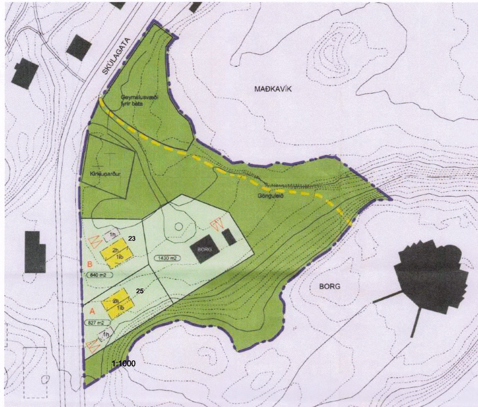
Gildandi deiliskipulag: Stykkishólmur Borg samþykkt 22. mars 2007