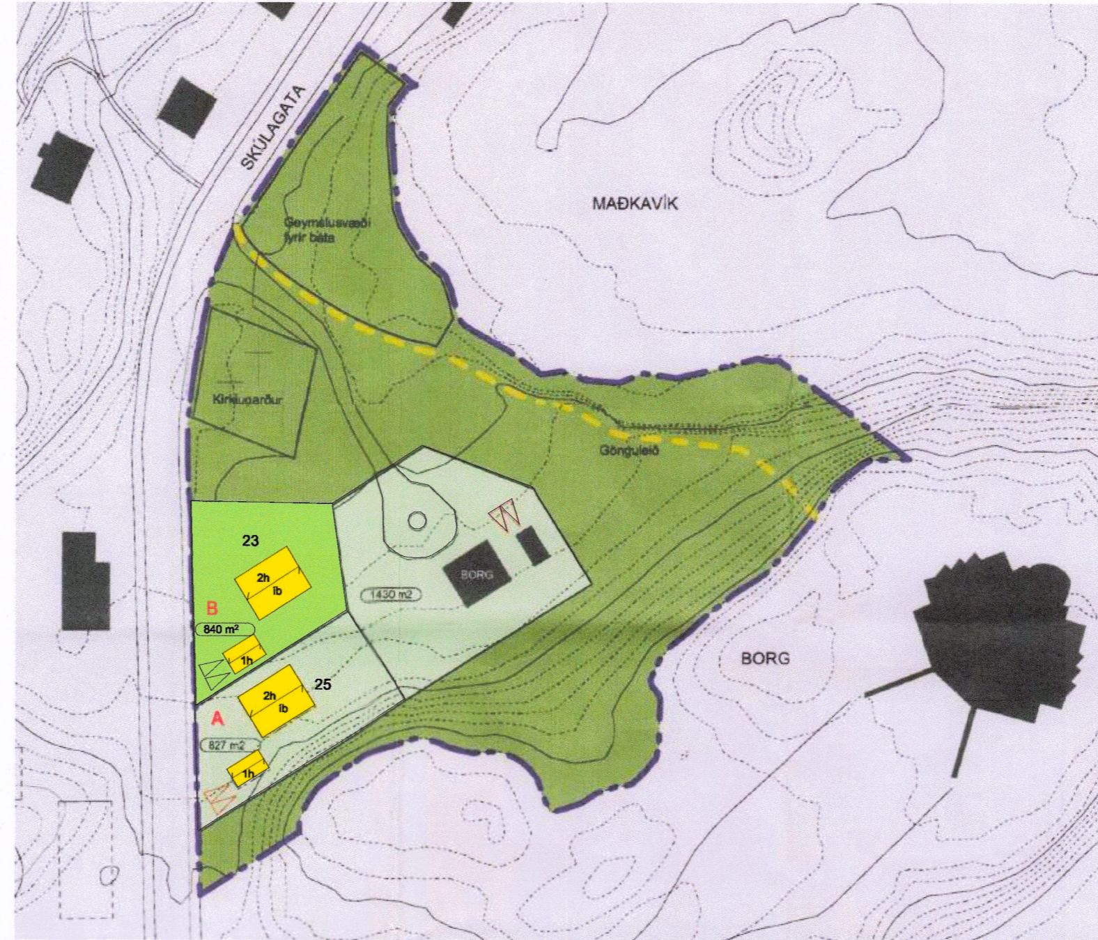
1:1000 Breyting á deiliskipulagi: Skúlagata 23

Óveruleg breyting á deiliskipulagi fyrir Skúlagötu 23 felst í færslu á byggingarreit fyrir bílskúr suður fyrir húsið og nær götu til samræmis við staðsetningu á bílskúrsreit við Skúlagötu 25.