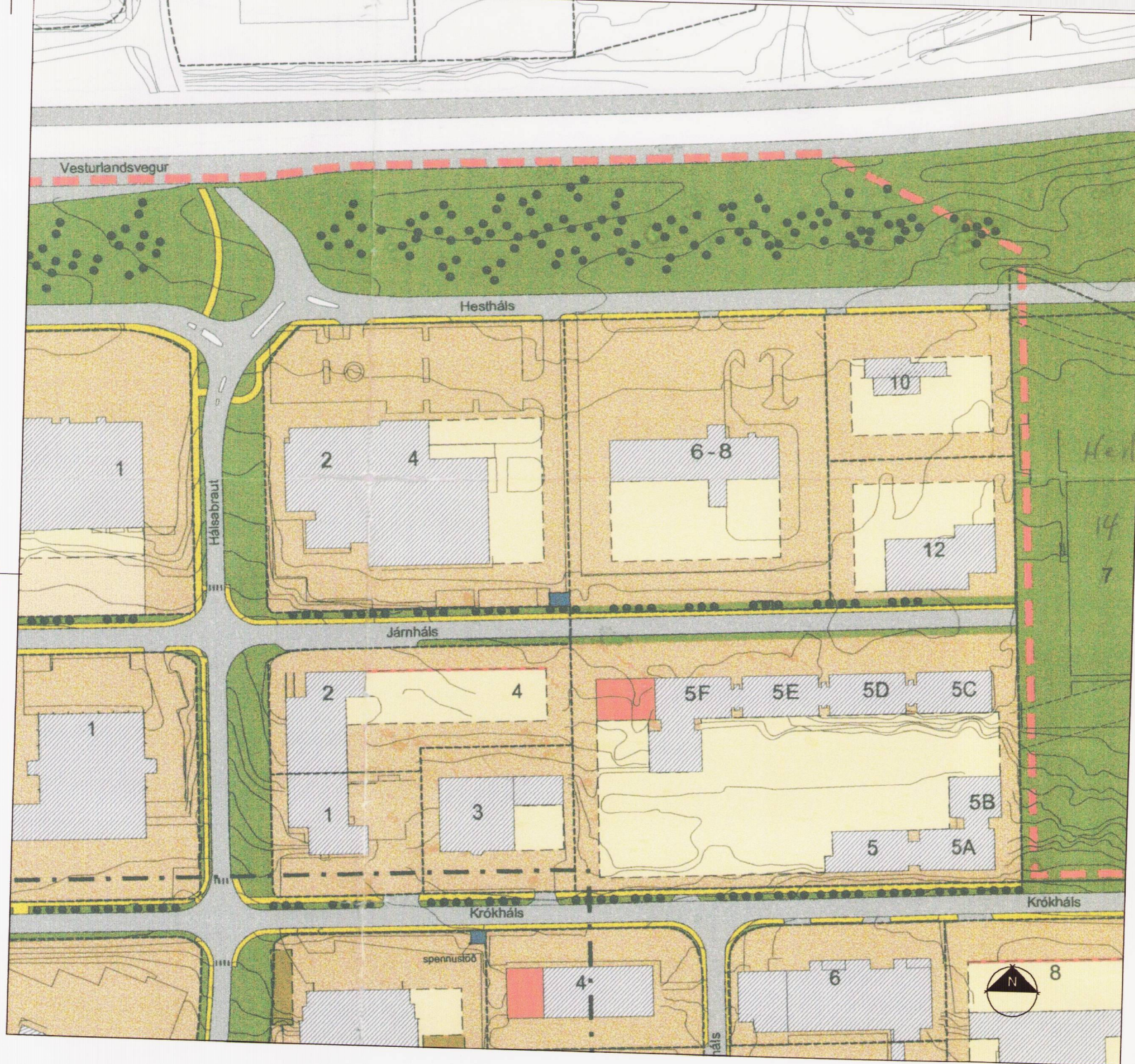
GILDANDI DEILISKIPULAG HÁLSAHERFIS SAMÞYKKT Í BORGARRÁÐI 26.09.2000 mkv.1:2000

Greinargerð Í breytingunni felst að komið er fyrir strætisvagnabíðstöð sunnan Vesturlandsvegur austan við undirgöng undir Vesturlandsveg við Viðarhófa. Vegtengingu er komið fyrir milli Vesturlandsvegur og Hesthals. Vegtengingin verður eingöngu fyrir strætisvagna og er háð staðsetningu á starfsemi Strætó bs. við Hesthals. Leggist starfsemi Strætó bs af við Hesthals eða breytist með þeim hætti að ekki verði þörf fyrir þessa aðkomu fyrir strætisvagna mun Reyjavíkurborg láta fjárlæga vegtenginguna. Vegg verður komið fyrir við strætisvagnabíðstöðina sem skemur farþega frá hávaða og vatnsúða vegna umferðar á Vesturlandsvegi. Hámarkshæð veggjar er 2,20 m.