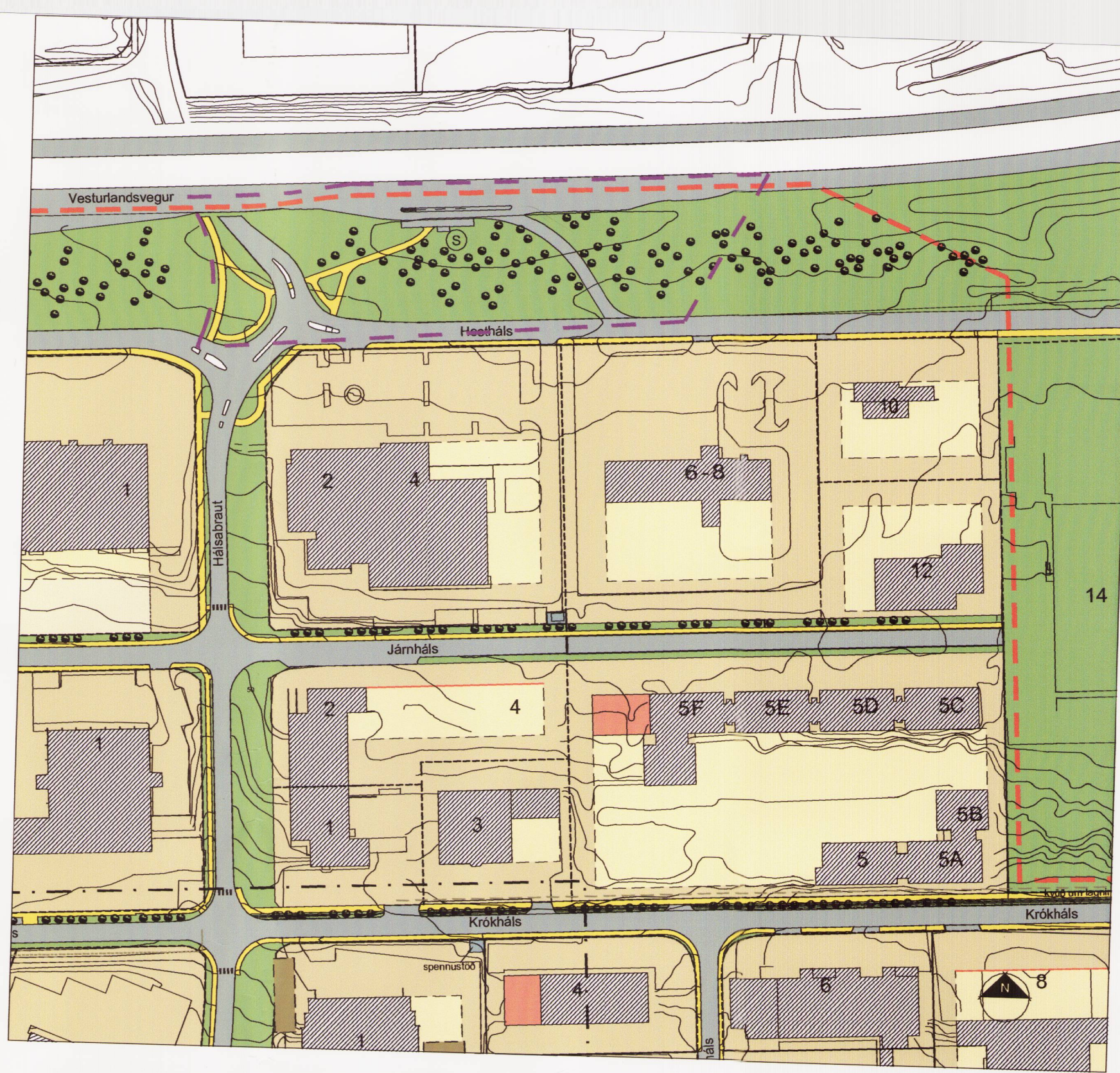
TILLAGA AÐ DEILISKIPULAGSBREYTINGU mkv.1:2000