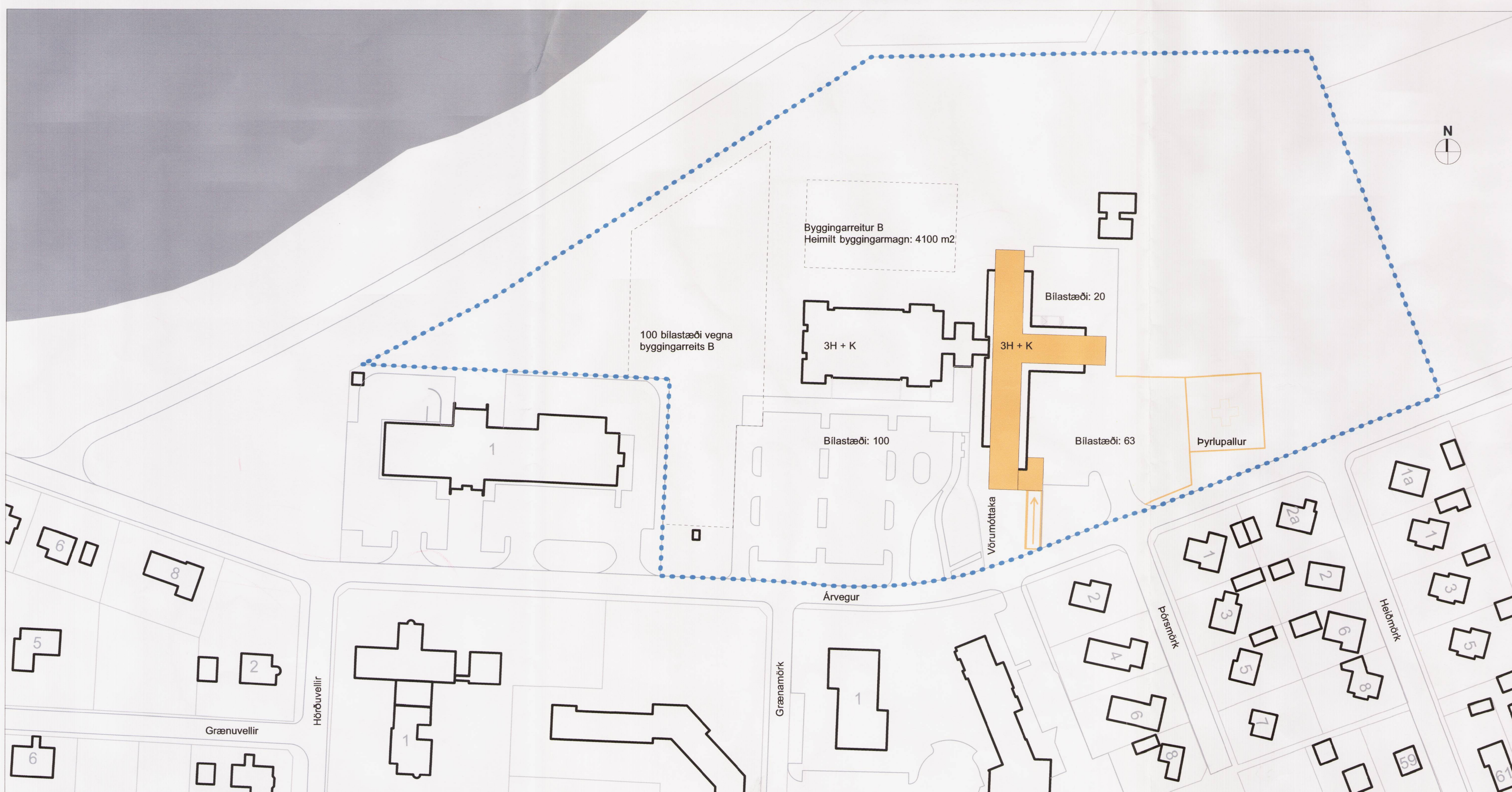
BREYTING Á DEILISKIPULAGI MKV. 1-1000