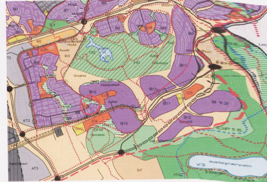
Aðalskipulag Hafnarfjarðar 2013-2025