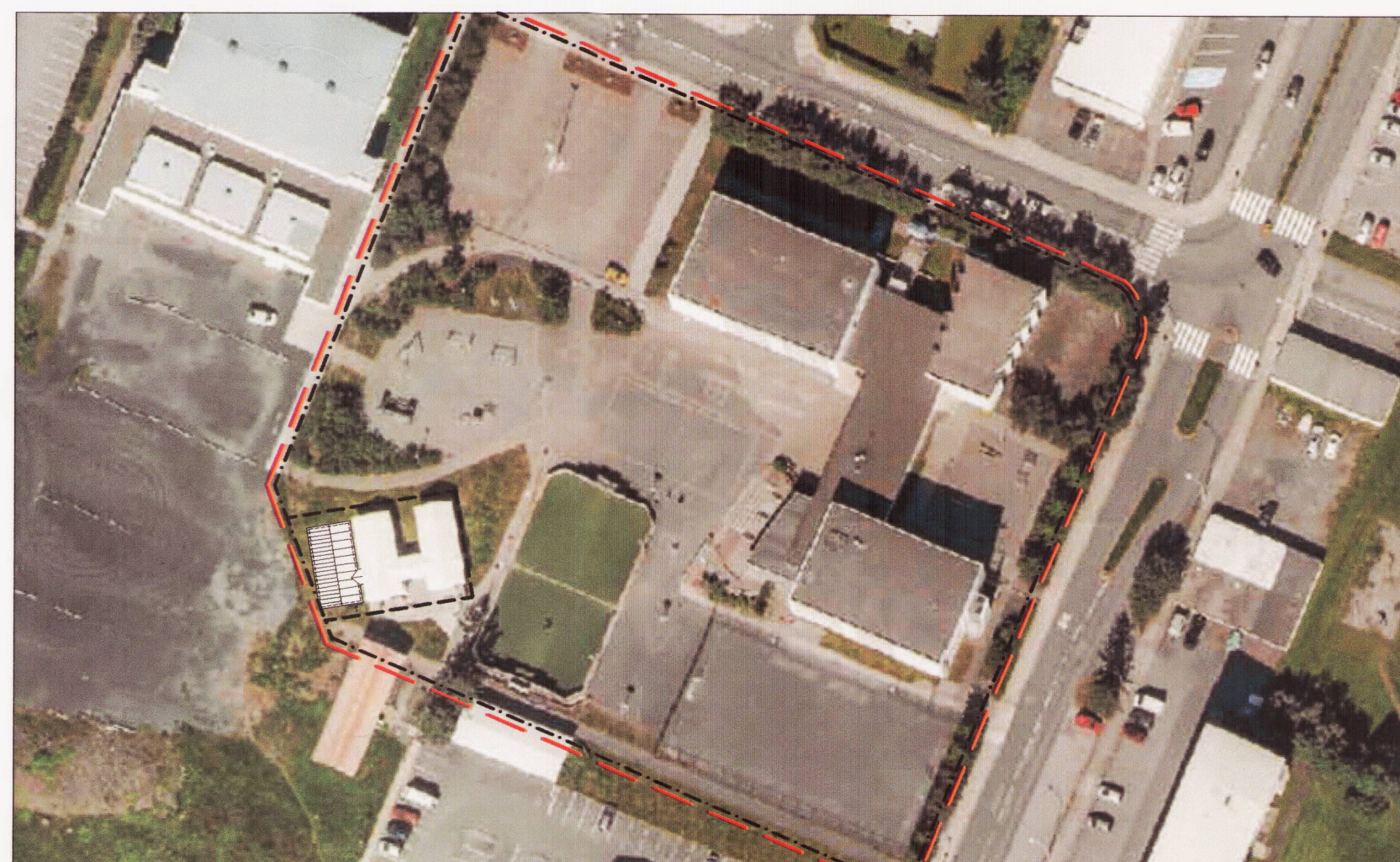
Skýringarmynd með færarlegri kennslustofu bætt inn á.