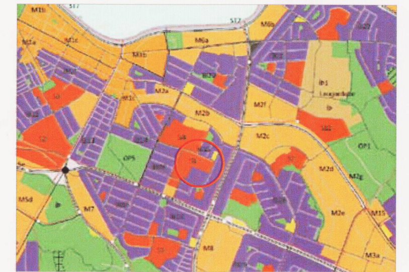
HLUTI AÐALSKIPULAGS REYKJAVÍKUR 2001-2024