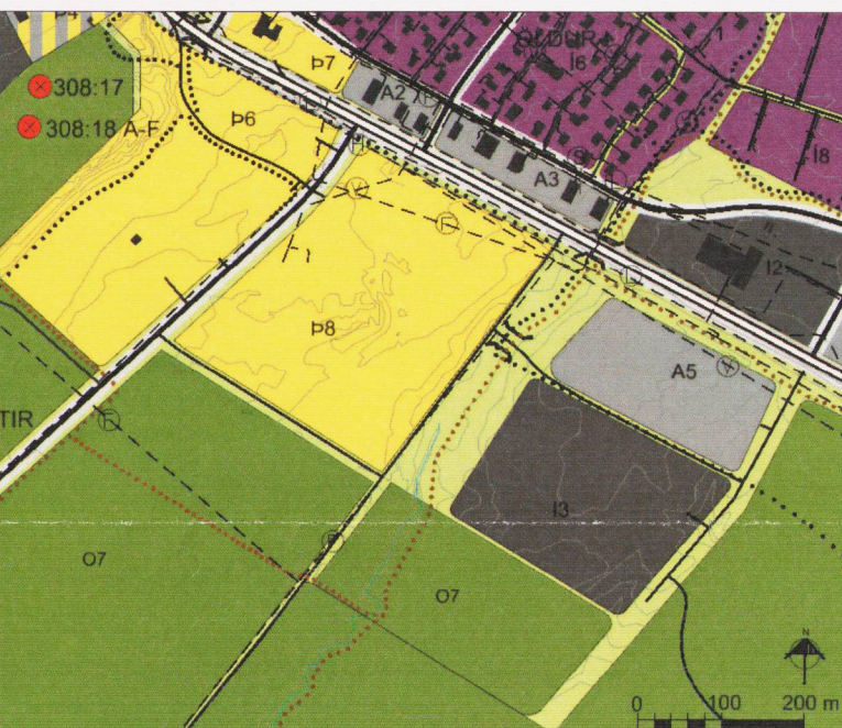
Breytt aðalskipulag Rangárbæings ytra á Hella 2010-2022. Mkv. 1:10.000.