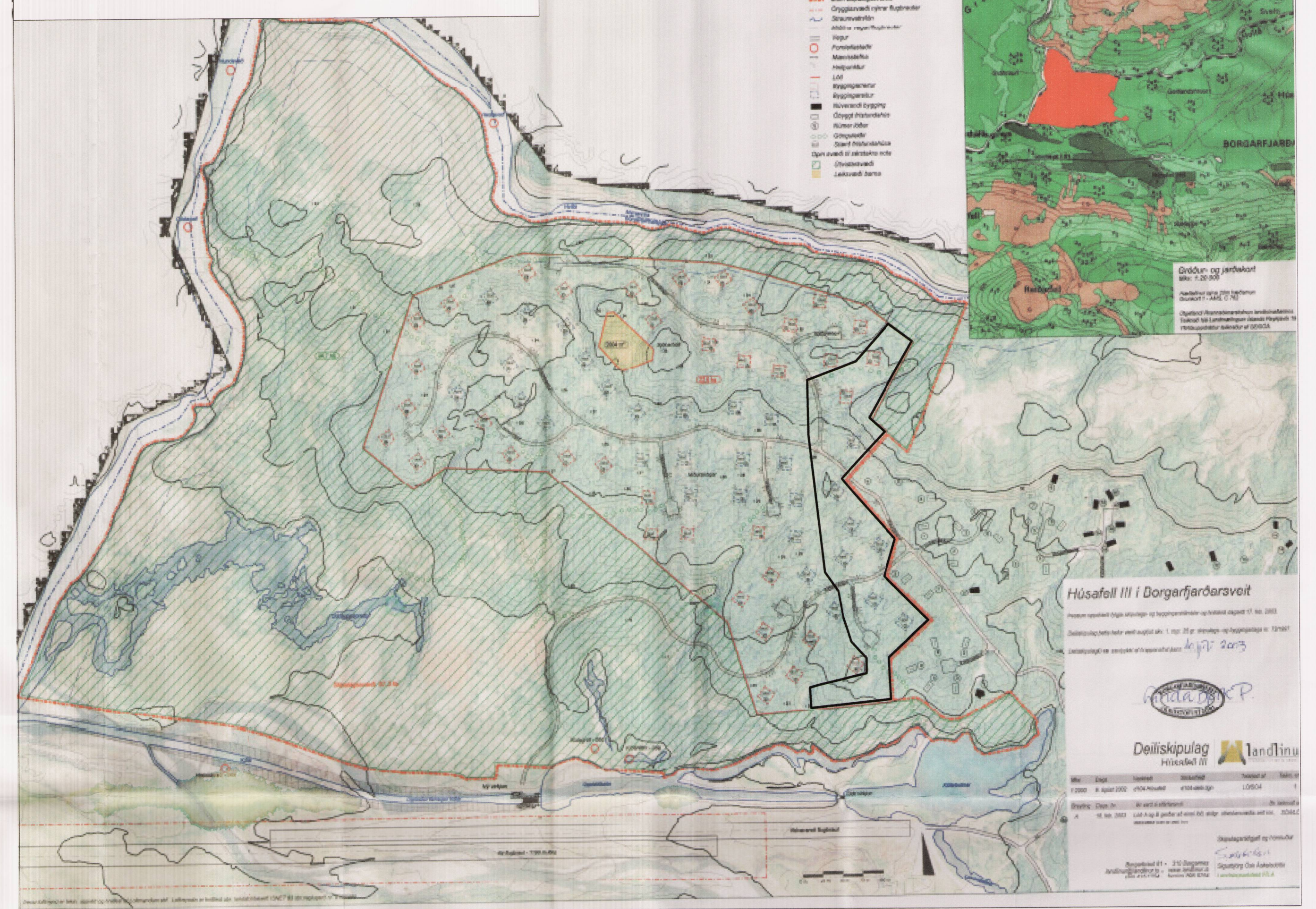
ADALSKIPULAG BORGARBYGGÐAR 2010-2022