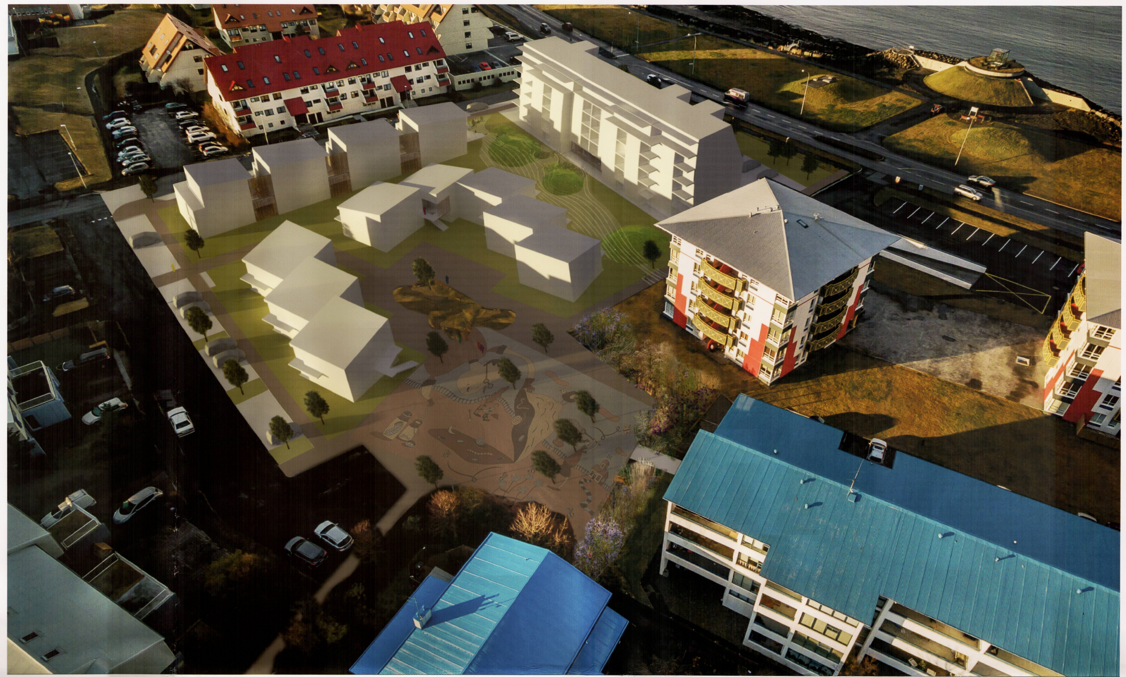
Horft yfir nýja byggð til norðvesturs - lýðheilsugarður í forgrunni