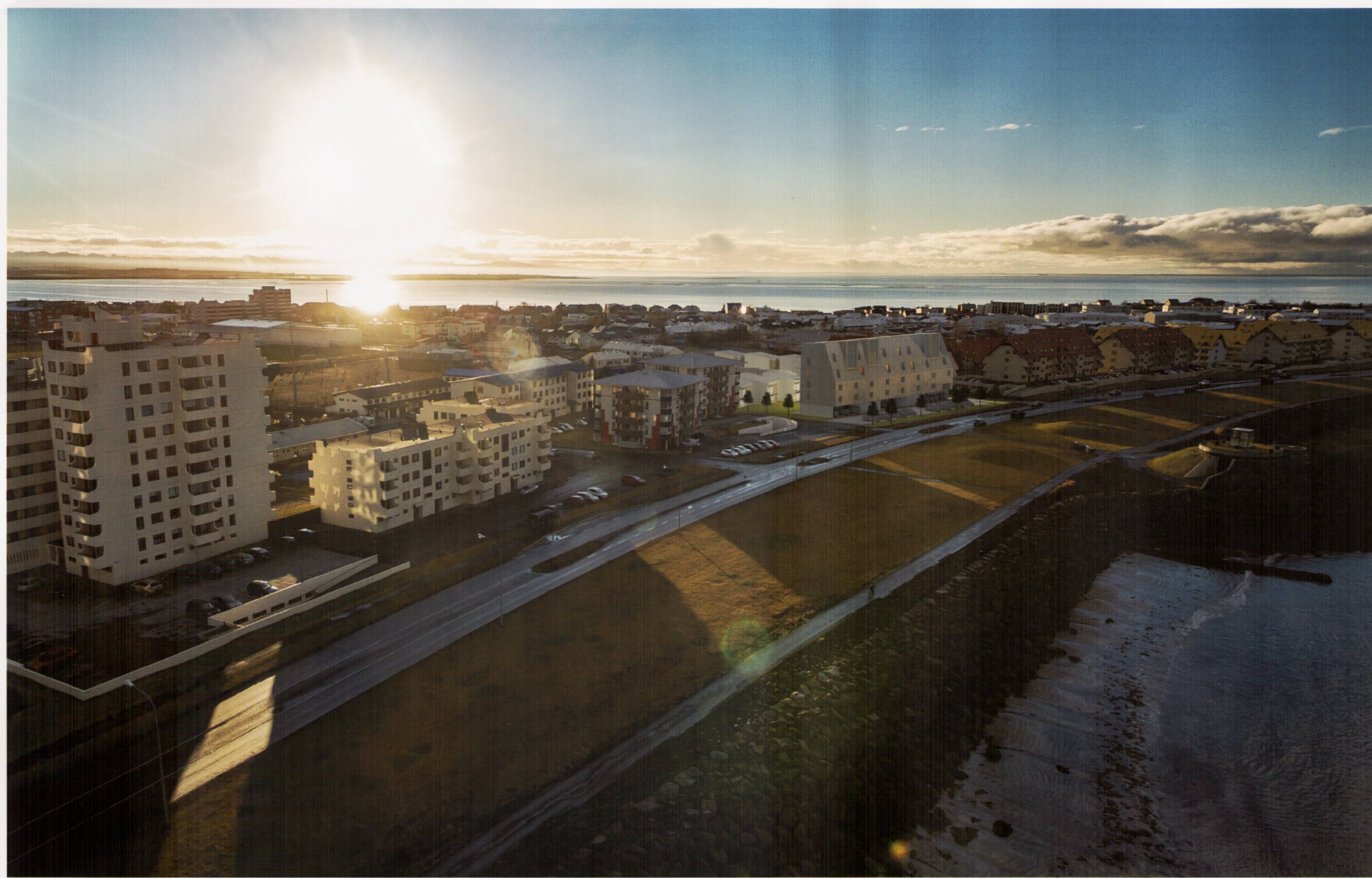
Yfirlit yfir svæðið - horft til suðvesturs