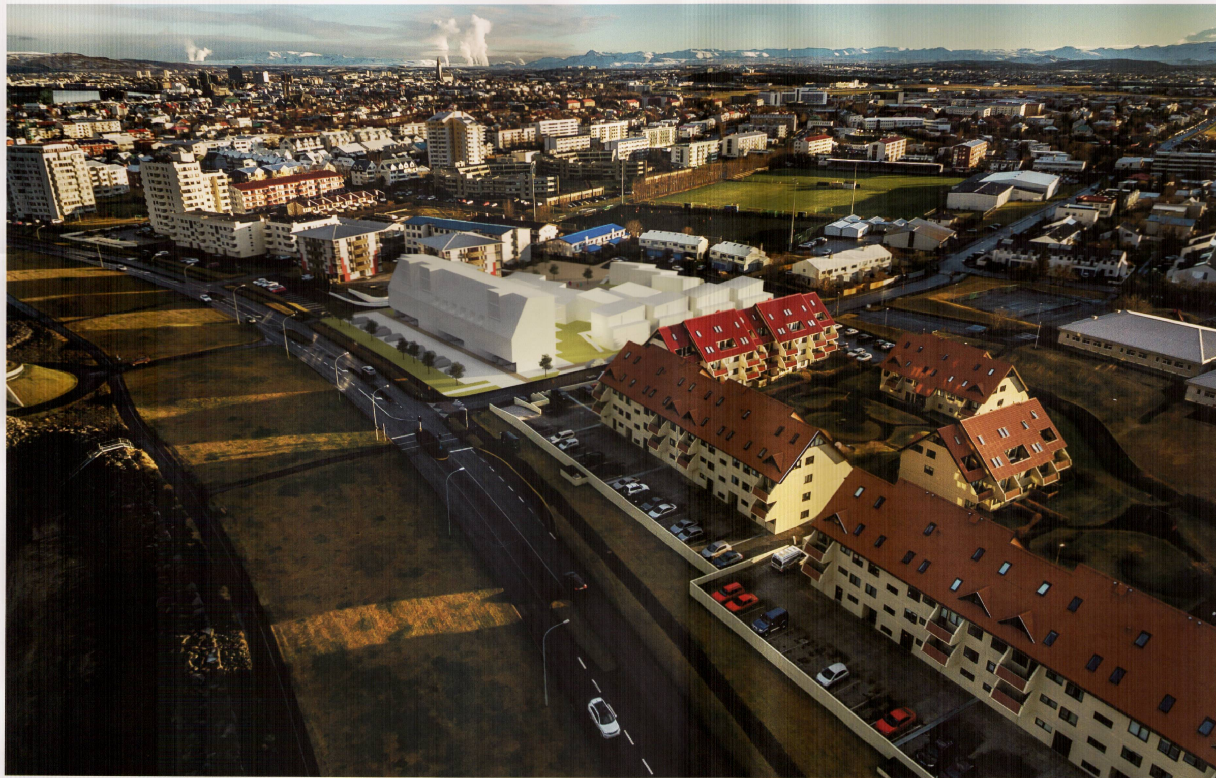
Horft yfir svæðið til austurs - hluti bílastæða við Eiðsgranda verða undir 2. hæð