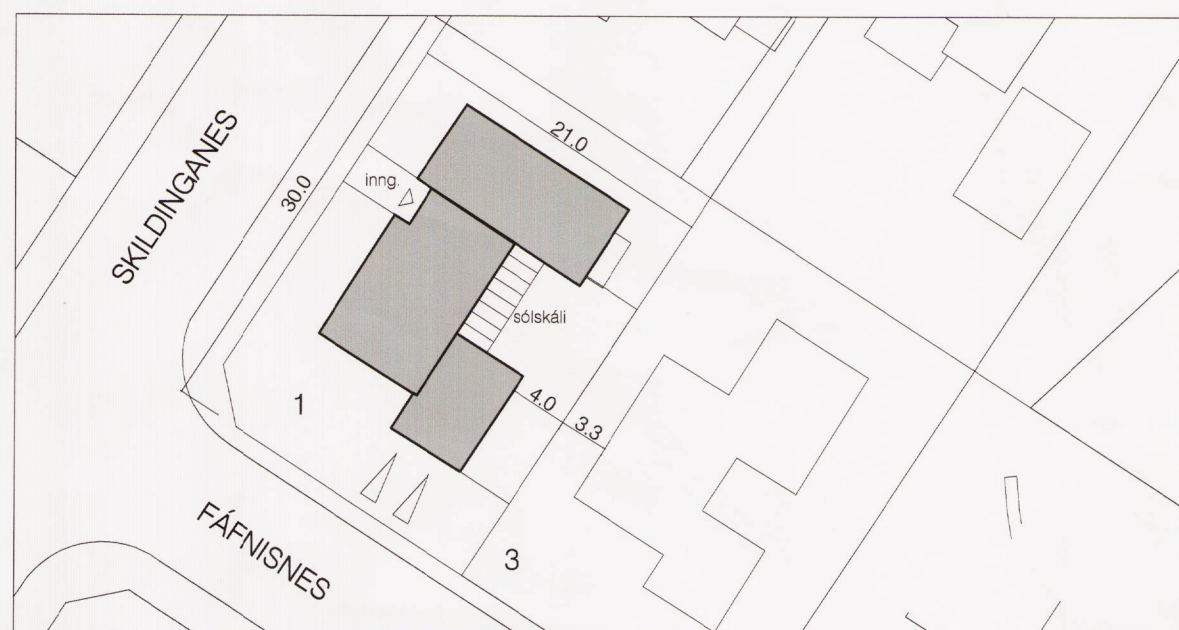
Staðsetning sólskála á afstöðumynd m. 1:500