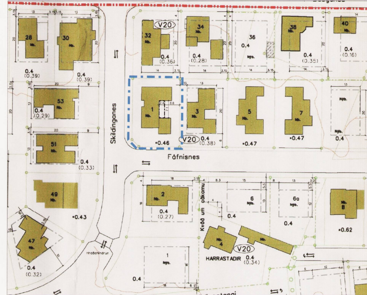
Fáfnisnes 1 - tillaga að breytingu m. 1:1000