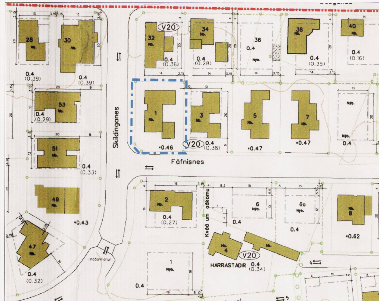
Gildandi deiliskipulag Skildinganes samþykkt í borgarráði 24.02.2004 með síðari breytingum m. 1:1000