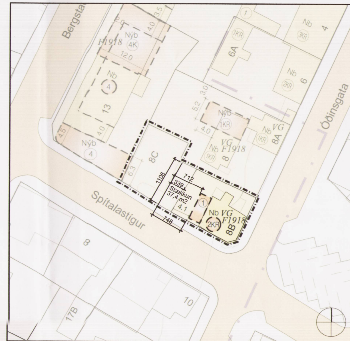
TILLAGA AÐ BREYTINGU Á DEILISKIPULAGI 1:500