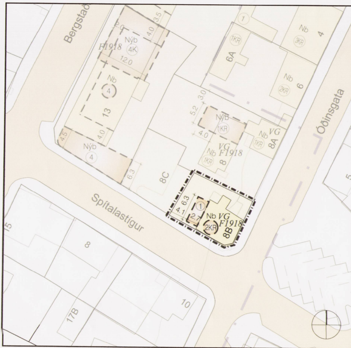
NÚVERANDI DEILISKIPULAG ÓÐINSGÖTU 8 B OG 8C, REIT 0-1- 1180307 Samþykkt í Borgarráði 24. ágúst 2016 og auglýst í B deild 22.september 2016