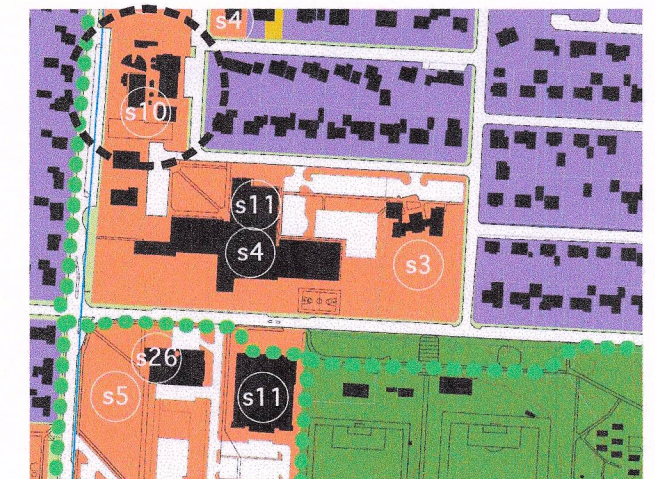
Hluti úr aðalskipulagi Árborgar 2010 - 2030, ekki í kvarða.

Skipulags- og byggingarfulltrúi Árborgar Samþykkt deiliskipulagsbreytingarinnar var auglýst í B-deild Stjórnartíðinda þann