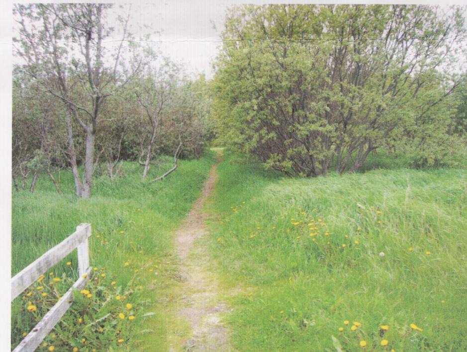
Núverandi slóði, horft til vesturs.

Stígurinn mun liggja meðfram núverandi limgerði þar sem myndast hefur trúin gönguleið.