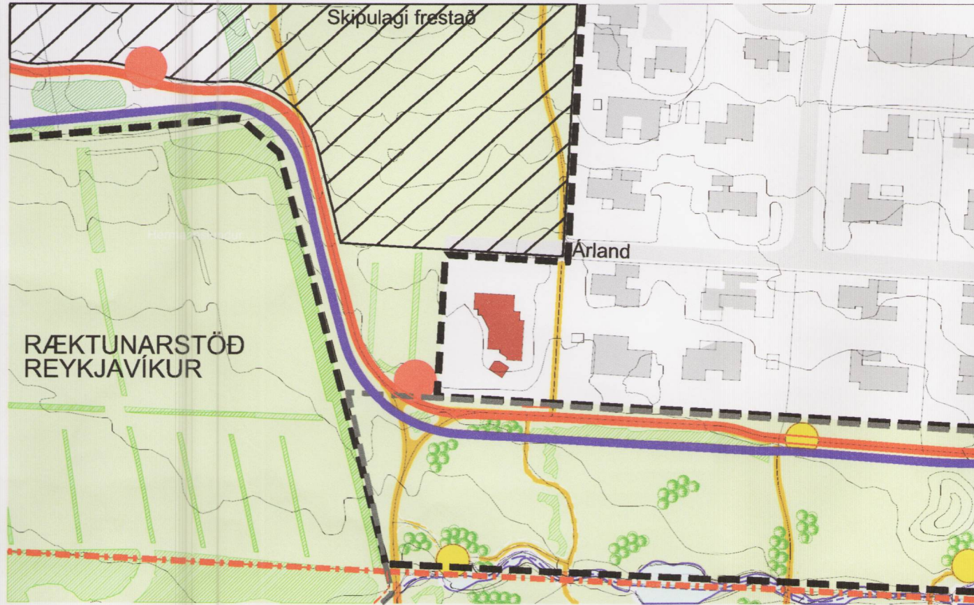
Samþykkt deiliskipulag, mkv. 1:2.000.