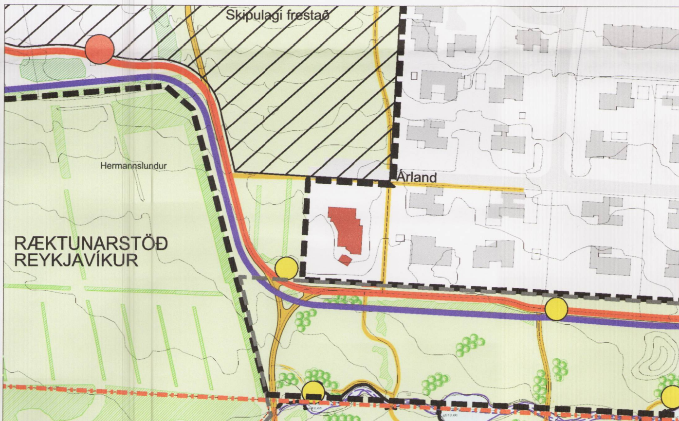
Tillaga að breytingu á deiliskipulagi, mkv 1:2.000.