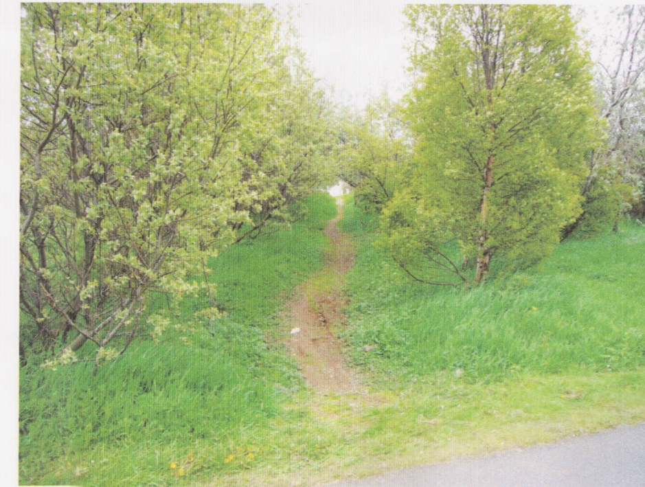
Núverandi slóði, horft til austurs.