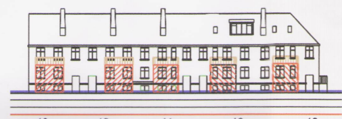
SKÝRINGARMYND FRAMNESVEGAR 14 - BAKHLIÐ FYRIR BREYTINGU