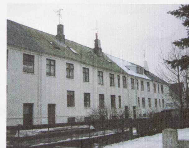
ÚTLIT FRÁ BAKGARÐI - NÚVERANDI STAÐA

Deiliskipulagsbreyting þessi sem fengið hefur meðferð í samræmi við ákvæði 2. mgr. 43. gr. skipulagslaga nr. 123/2010 var samþykkt í deiliskipulagsráði þann 13.5.2011 .