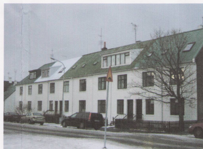
ÚTLIT FRÁ FRAMNESVEGI - NÚVERANDI STAÐA

Breytingin felur í sér að á þak rishæðar komi kvistir, einn á hvora hlið, og verði ekki breiðari en 1/2 hluti breiddar þaksins. Að öðru leyti vísast til almennra skilmála gildandi deiliskipulags.