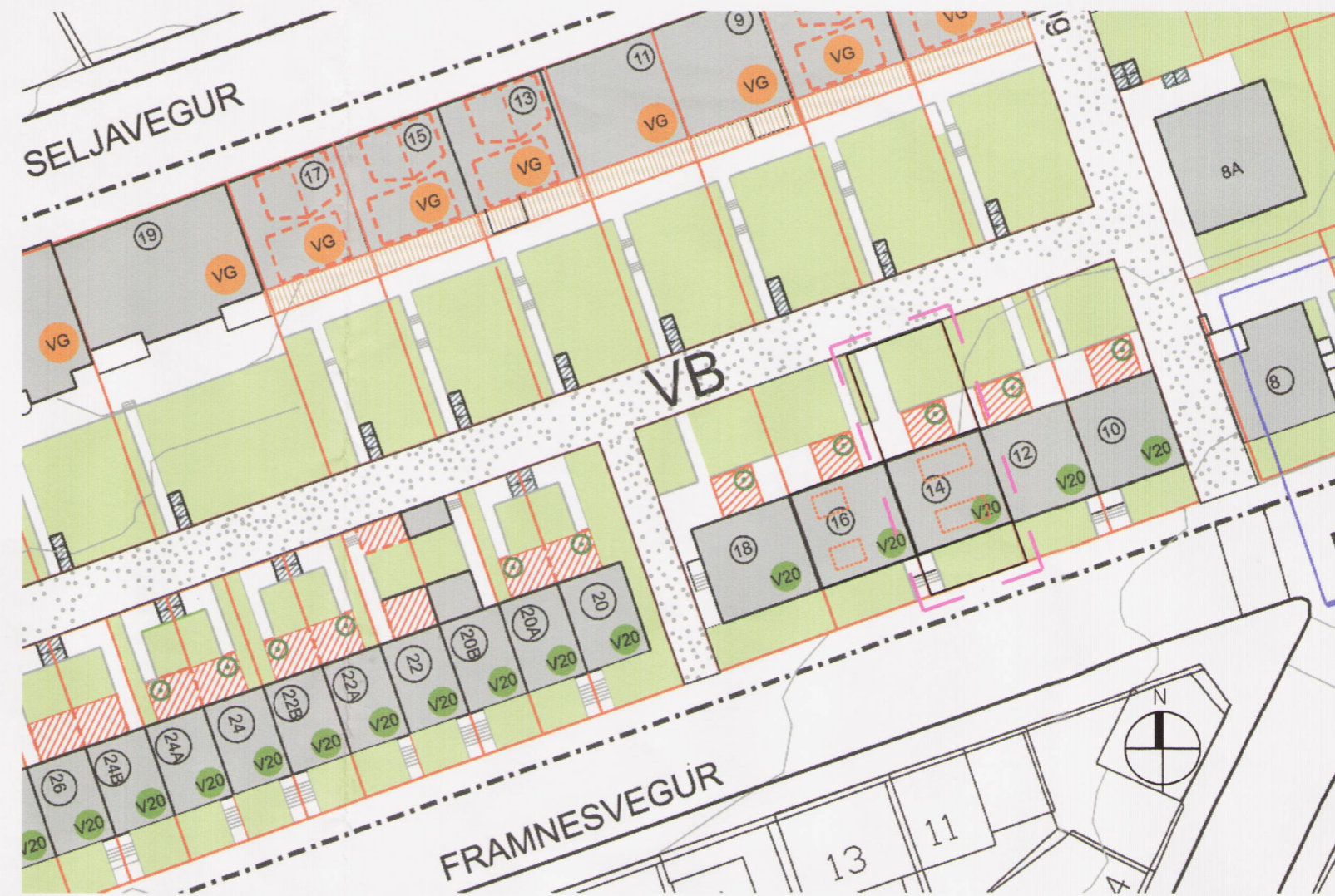
DEILISKIPULAG EFTIR BREYTINGU 1:500