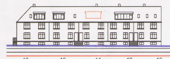
SKÝRINGARMYND FRAMNESVEGAR 14 - FRAMHLIÐ EFTIR BREYTINGU