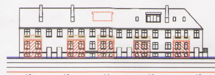
SKÝRINGARMYND FRAMNESVEGAR 14 - BAKHLIÐ EFTIR BREYTINGU