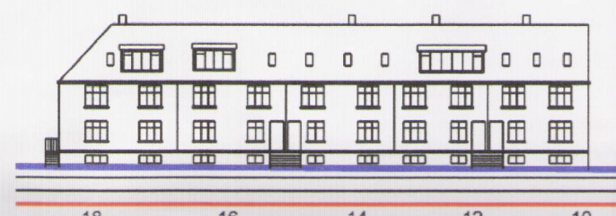
SKÝRINGARMYND FRAMNESVEGAR 14 - FRAMHLIÐ FYRIR BREYTINGU