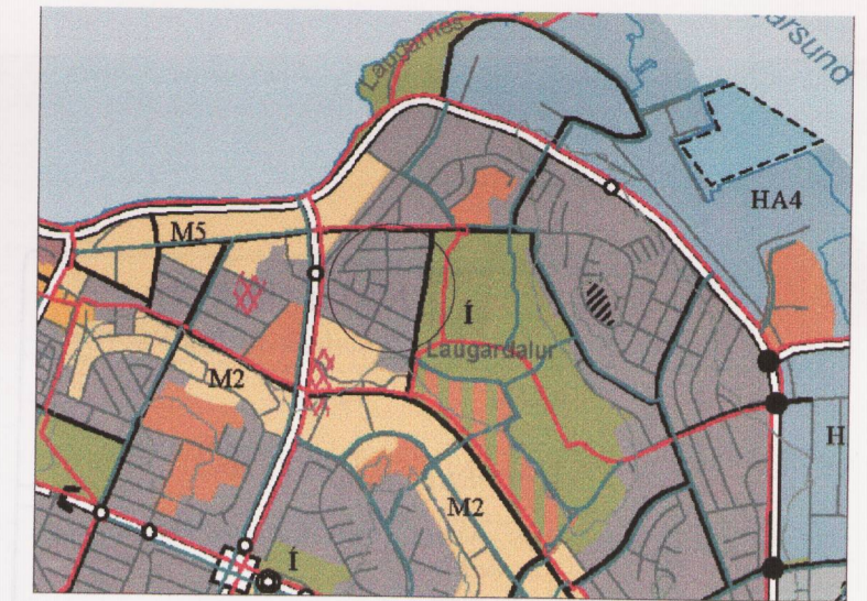
HLUTI AÐALSKIPULAGS REYKJAVÍKUR 2001-2024