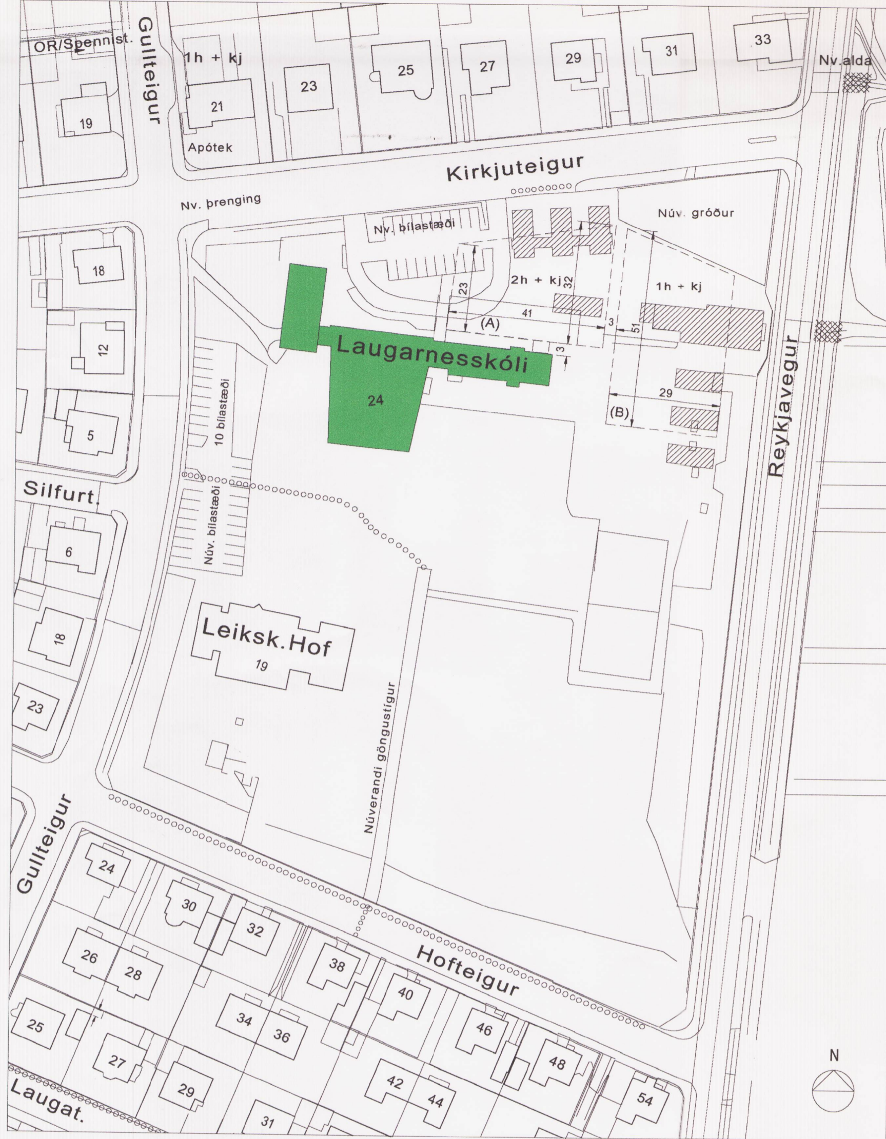
HLUTI GILDANDI DEILISKIPULAGS TEIGAHVERFIS, KIRKJUTEIGUR 24, LAUGARNESSKÓLI SAMÞYKKT Í BORGARRÁÐI 2. JÚLI 2002 - MKV. 1=1000