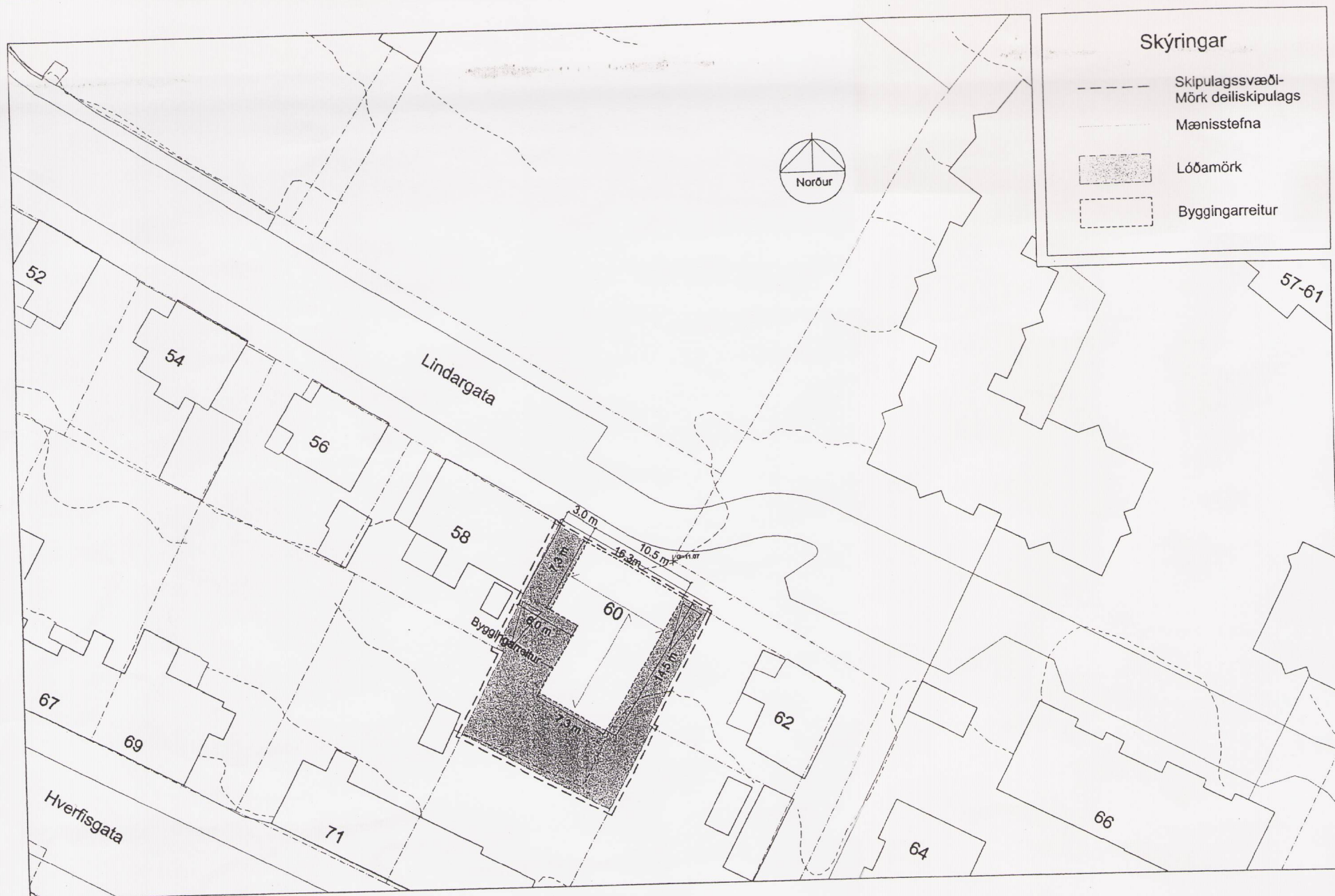
Gildandi deiliskipulag af lóð nr. 60 við Lindargötu, samþykkt í skipulags- og byggingarnefnd, 21.01.2003