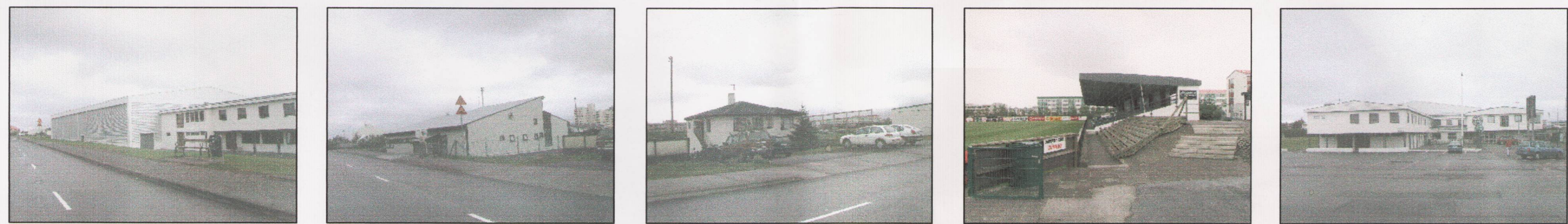
Frostaskjól 2 Frostaskjól 6 Frostaskjól 4 Núverandi stúka Frostaskjól 2 - aðkoma