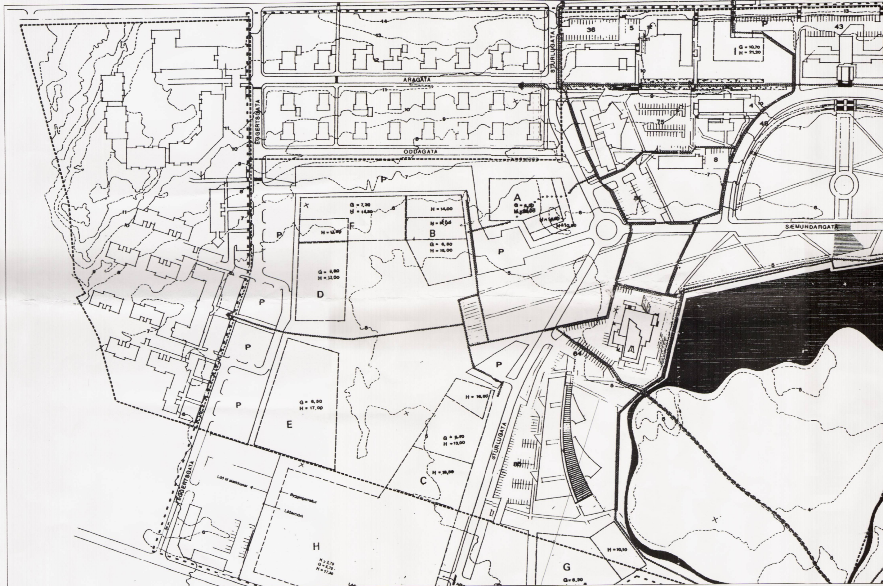
Gildandi deiliskipulag Háskóla Íslands - samþykkt í borgarráði 28.9.1999, með breytingu 14.9.2000 Mkv. 1:2000