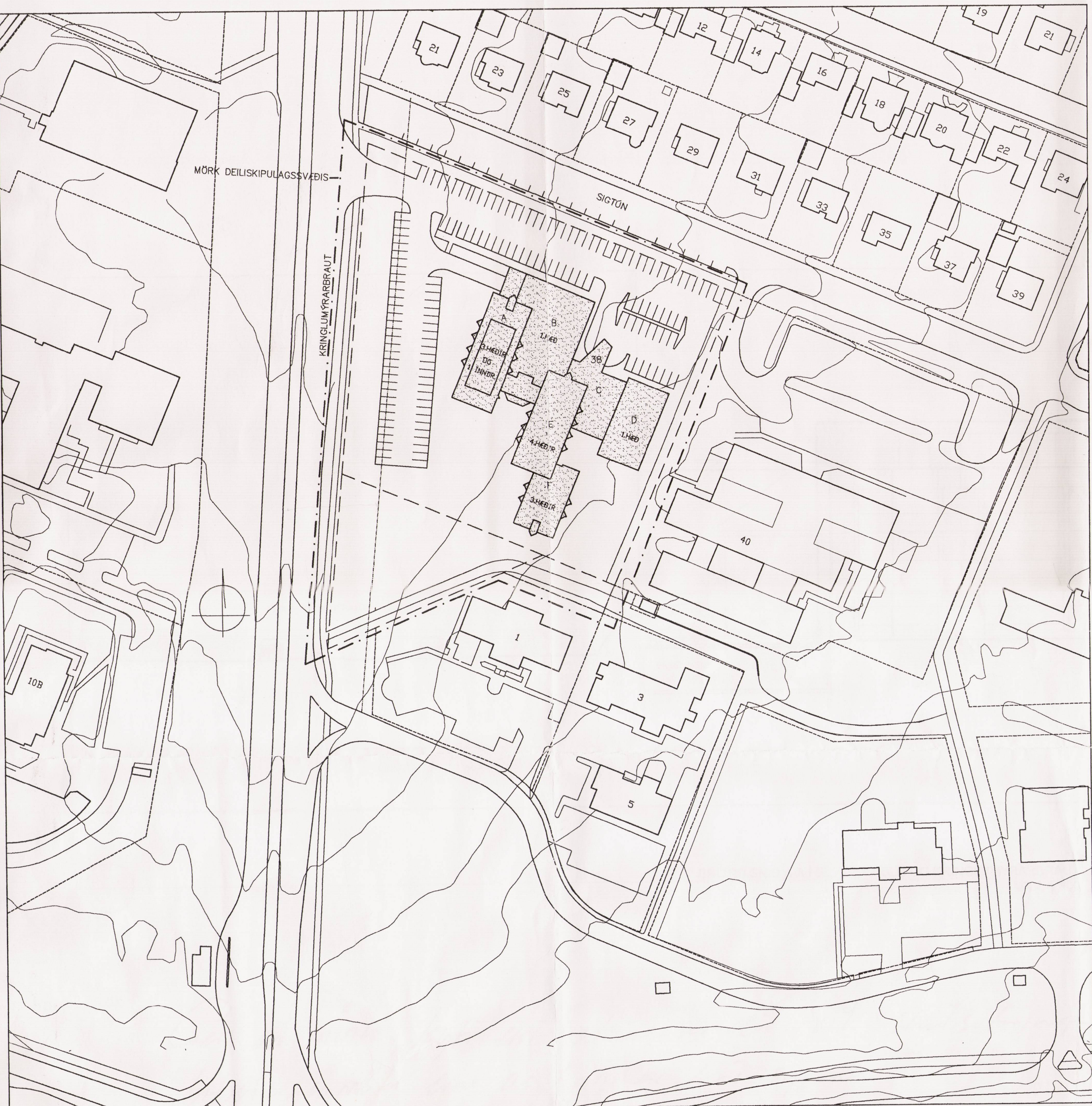
FYRIR BREYTINGU MKV. 1:1000