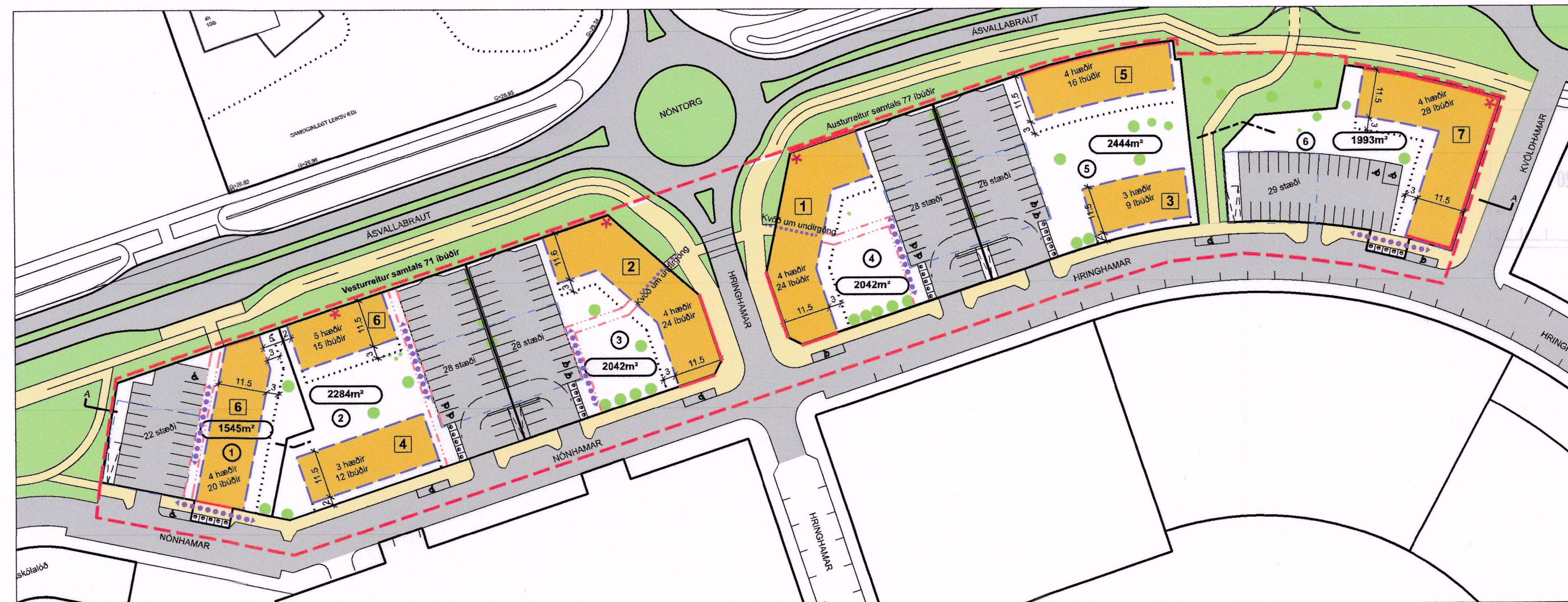
UPPFÆRT DEILISKIPULAG HAMRANES, REITIR 6, 10 OG 11

© ÖLL AFRÖT OG AFRITUN TEIKNINGAR ER HAD SAMÞYKKT ÁSK ARKITEKTA. EKKI SKAL MÆLA UPP AF TEIKNINGU.