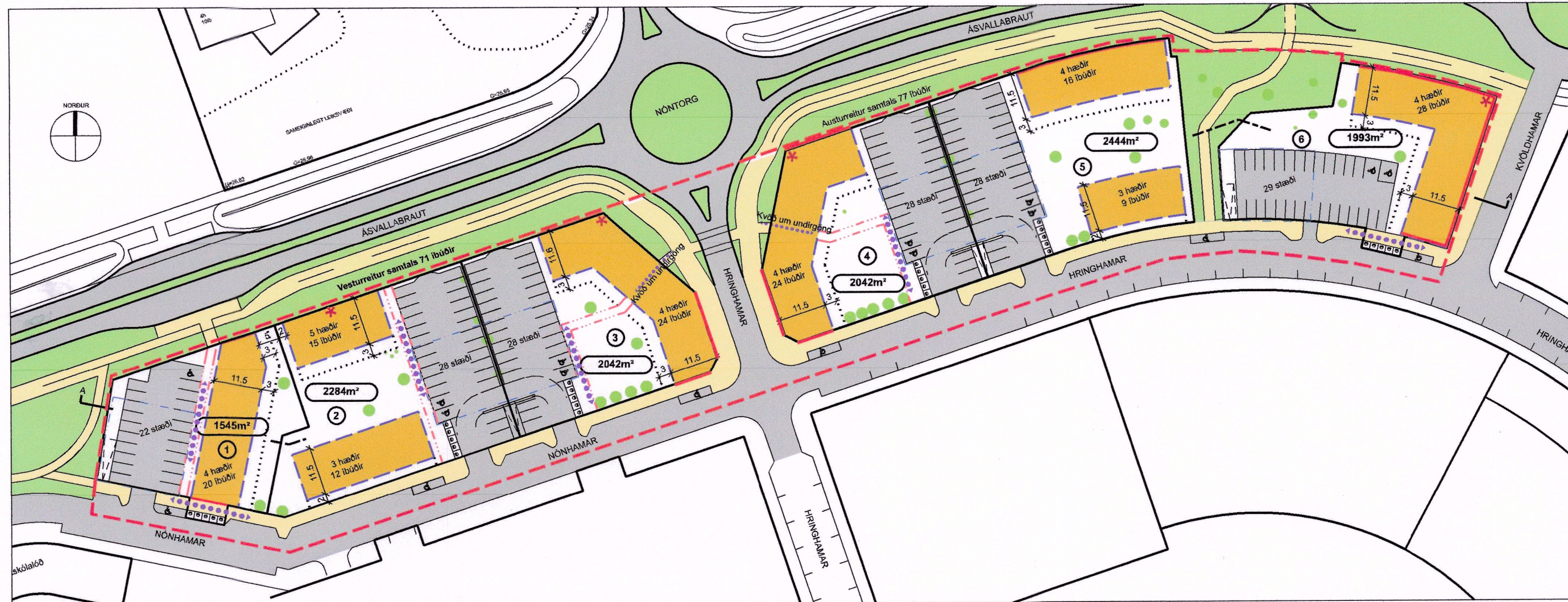
DEILISKIPULAG HAMRANES, REITIR 6, 10 OG 11 - Samp.19.08.2020 og auglýst í B-deild 02.10.2020