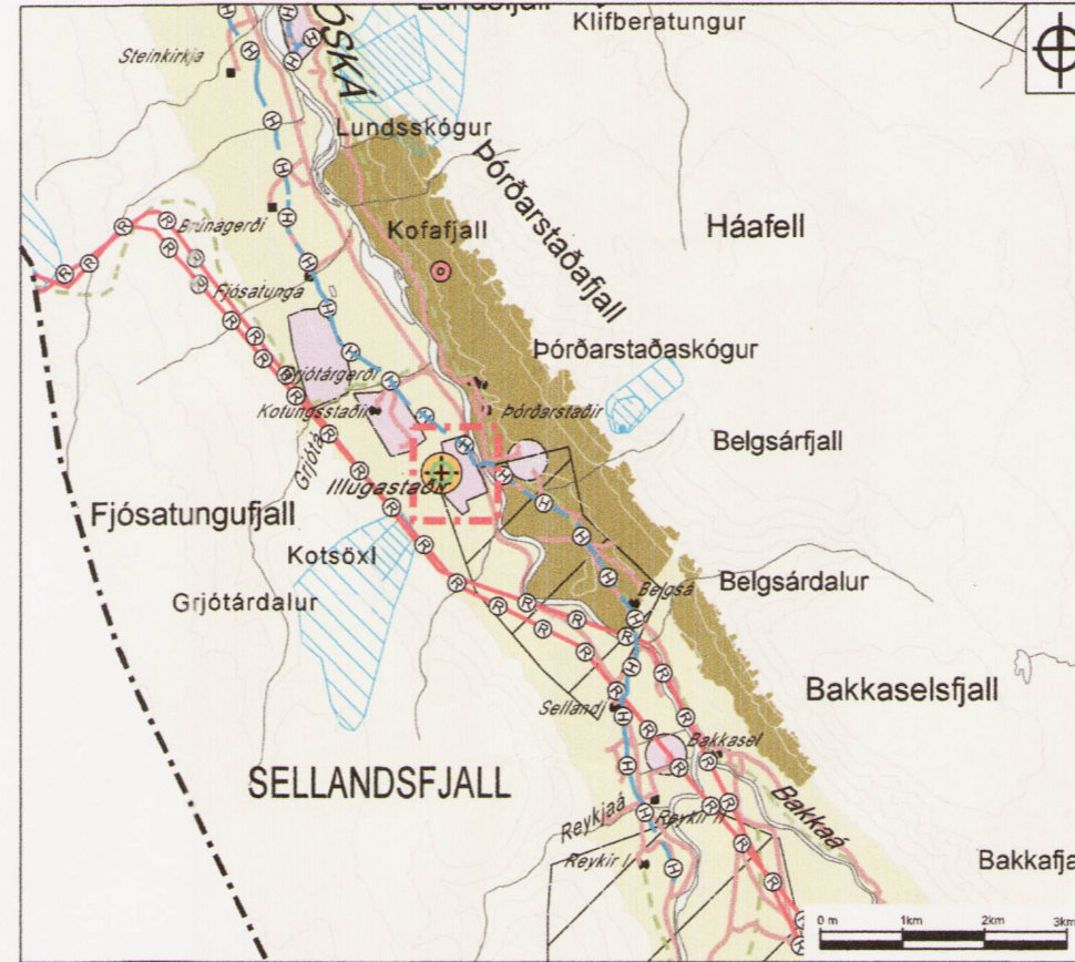
Tillaga að breytingu á Aðalskipulagi Þingeyjarsveitar mkv. 1:100.000