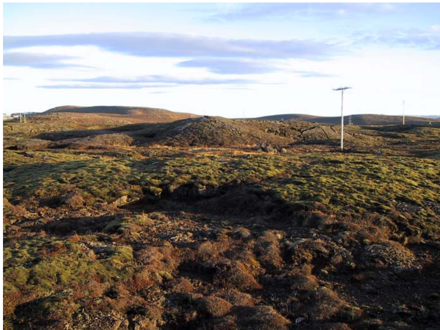
Horft að Grísanesi

Deiliskipulagið er sett fram í greinargerð þessari ásamt skipulagsupprætti og skýringarupprætti. Skipulagsuppráttur er í mælikvarða 1:1000, dags. 07.07.2005, þar sem settir eru fram helstu þættir skipulagsins.