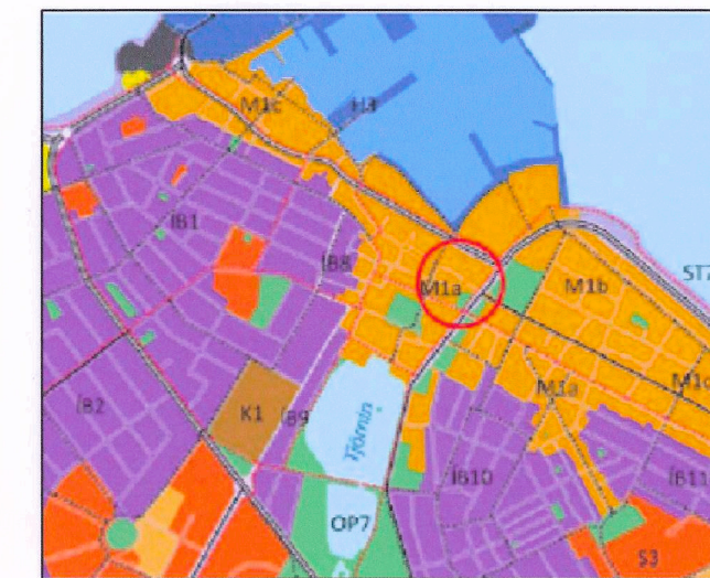
Hluti úr aðalskipulagi Reykjavíkur 2010-2030 - staðsetning breytingar.

Deiliskipulagsbreyting þessi sem fengið hefur meðferð í samræmi við ákvæði 1. mgr. 43. gr. skipulagslaga nr. 123/2010 var samþykkt í Borgarráði þann 10. jan. 20 19 og á embætti skipulagsfulltrúa þann 8. mars 20 19 .