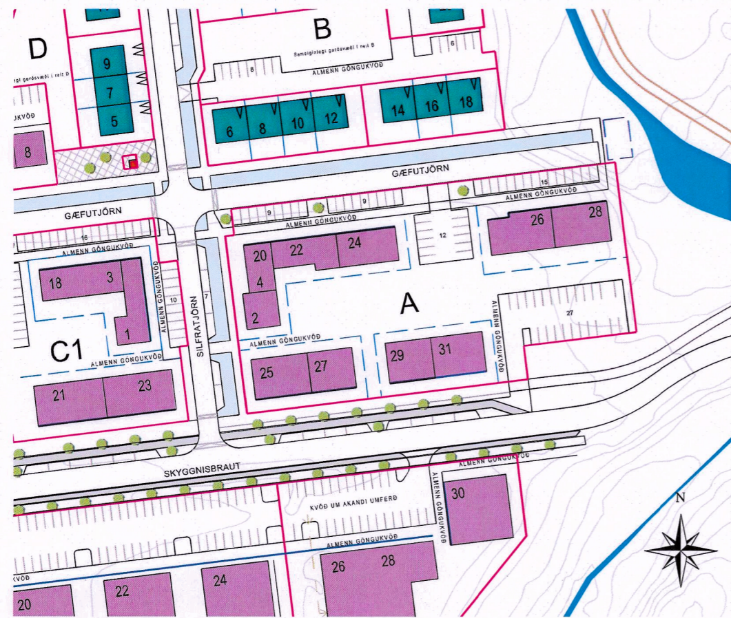
Gildandi deiliskipulagsuppráttur 1:1500

vegna Skyggisbrautar nr. 25-27 og 29-31, Gæfutjarnar nr. 20-24 og 26-28 og Silfratjarnar nr. 2-4