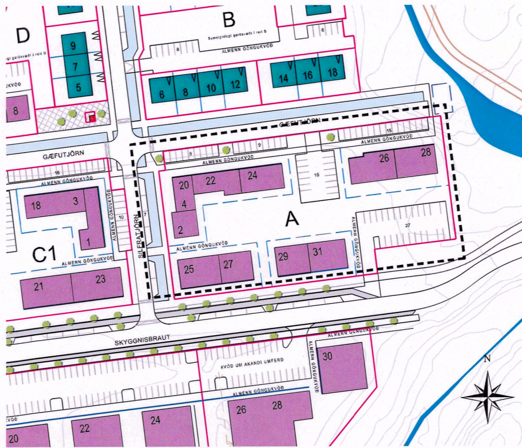
Tillaga að breytingu á deiliskipulagsupprátti 1:1500.

Breytingin er gerð til að uppfylla kröfur sem gerðar eru til félaga sem þiggja stofnframlag frá ríki og sveitarfélagi og byggja litlar hagkvæmar íbúðir fyrir félagsmenn sína. Þessi breyting gildir eingöngu fyrir slíkt félag og er ekki fordæmisgefandi.