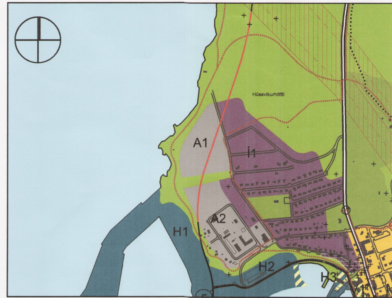
Aðalskipulag Norðurlþings 2010-2030 m.s.br. / Húsavík, 1:10.000

Í deiliskipulaginu verður fjallað nánar um tilhögun baðstaðar sem áformaður er á hluta þess svæðis sem breytingin fjallar um.