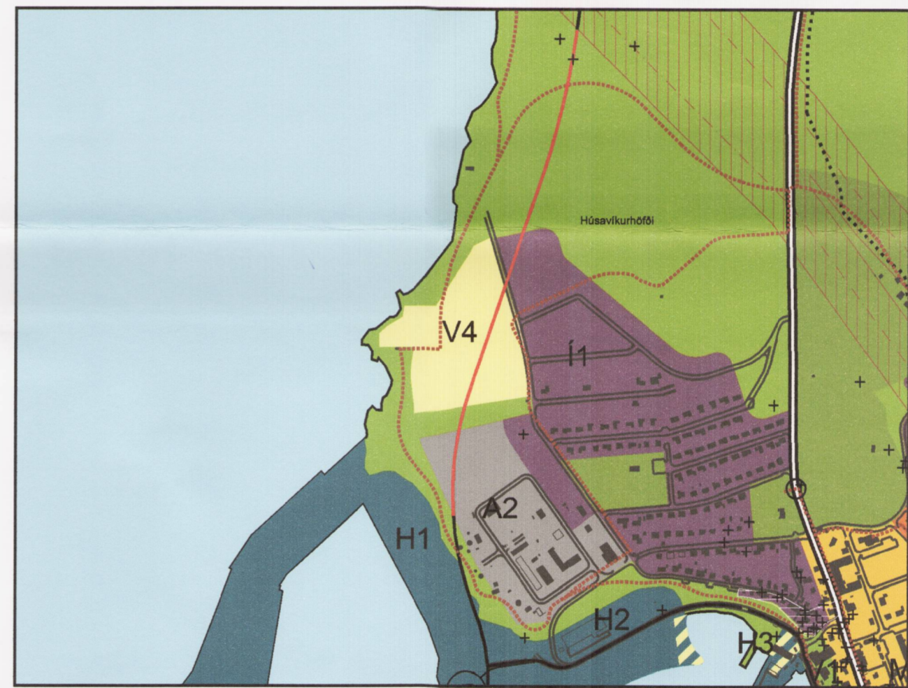
Uppdráttur eftir breytingu, 1:10.000