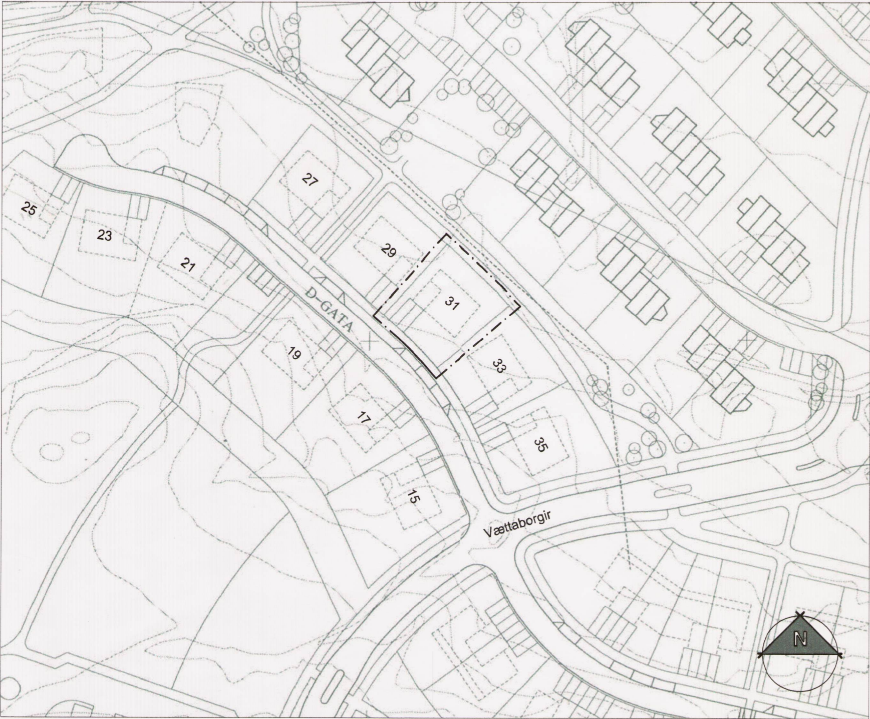
Hluti gildandi deiliskipulag „Borgahverfis A hluta“ samþykkt í borgarráði 21.03.1995, breyting samþykkt í borgarráði 03.02.2011 öðlaðist gildi 17.05.2011. Mkv. 1:1000