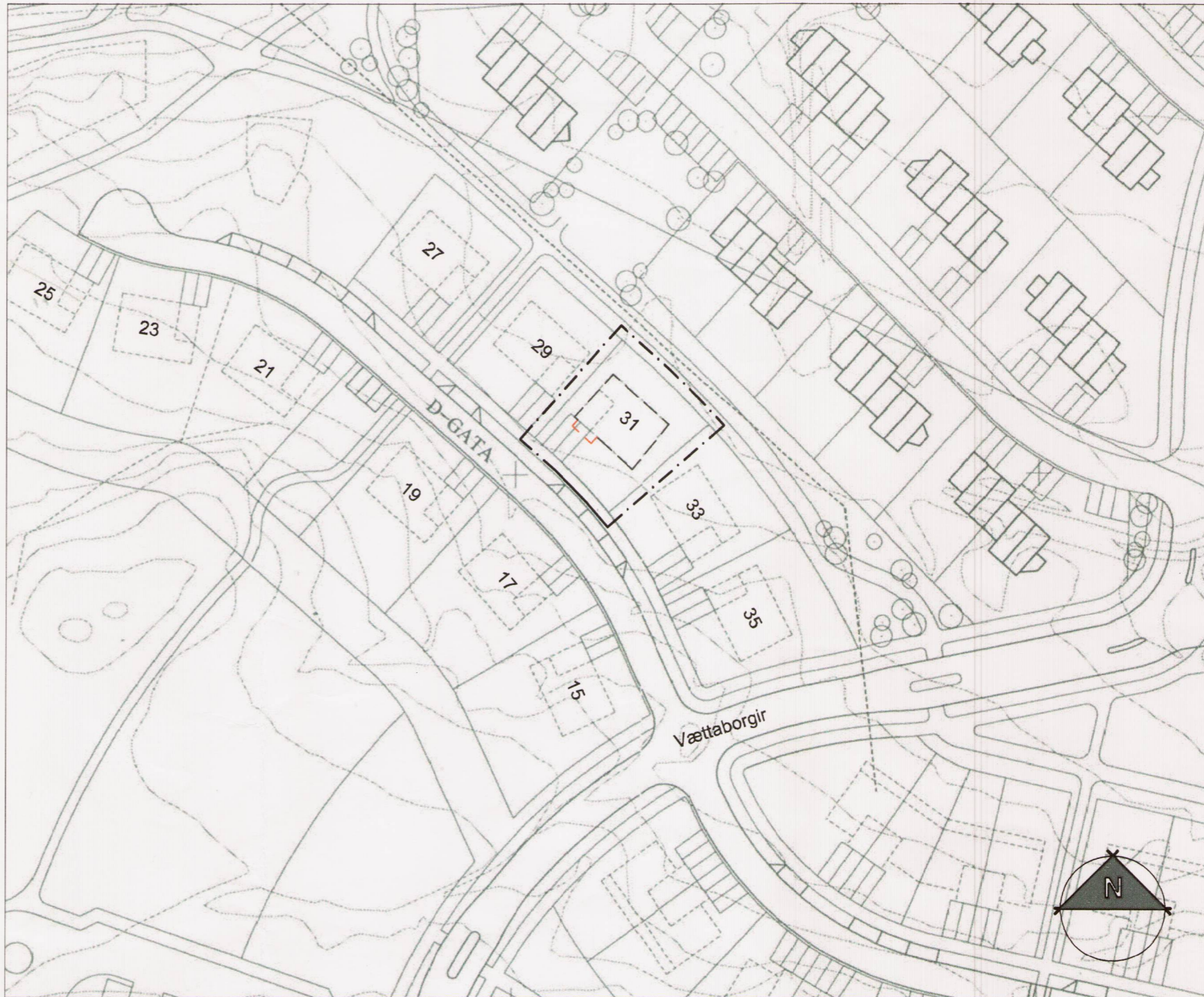
Tillaga að breytingu á deiliskipulagi vegna Vættaborga 31. Mkv. 1:1000