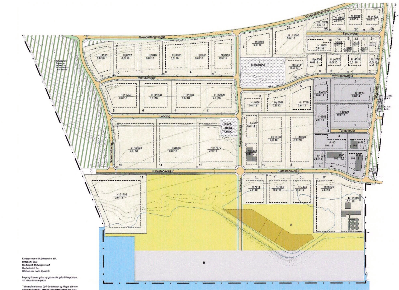
FYRIR BREYTINGU Deiliskipulag athafnasvæðis, athafna- og hafnarsvæðisog iðnaðarsvæðis á Grundartanga, vestursvæði. Breyting ágúst 2012 (EKKI í kvarða).