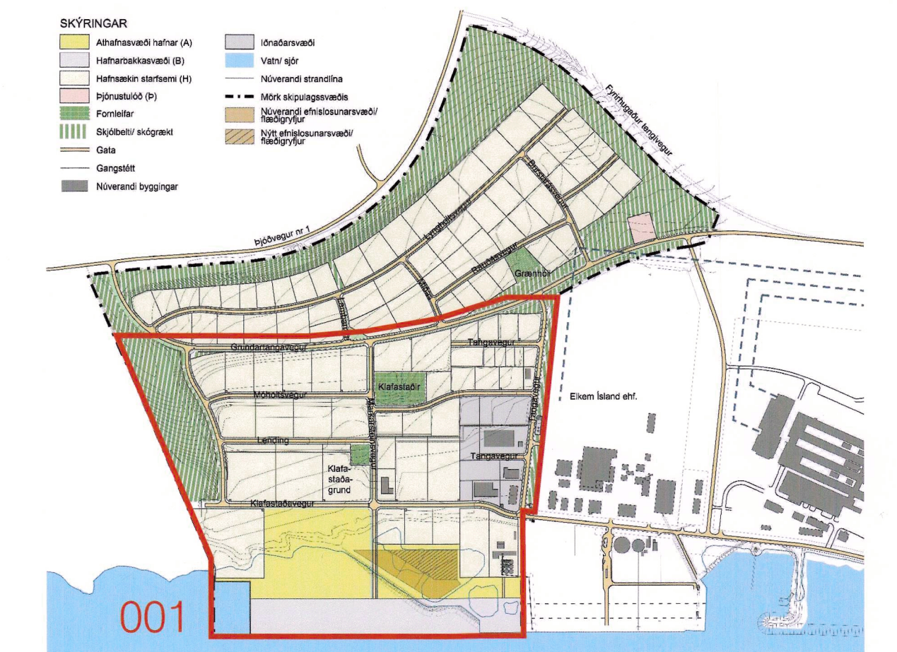
Vestursvæði, yfirlitssuppláttur heildarsvæði (uppdr. 004)

Önnur skipulagsgögn - Greinargerð, skipulags- og byggingarskilmálar, umhverfismat áætlaða dags. 2018-05-15 - Yfirlitssuppláttur nr. 004, dags. 2018-05-15