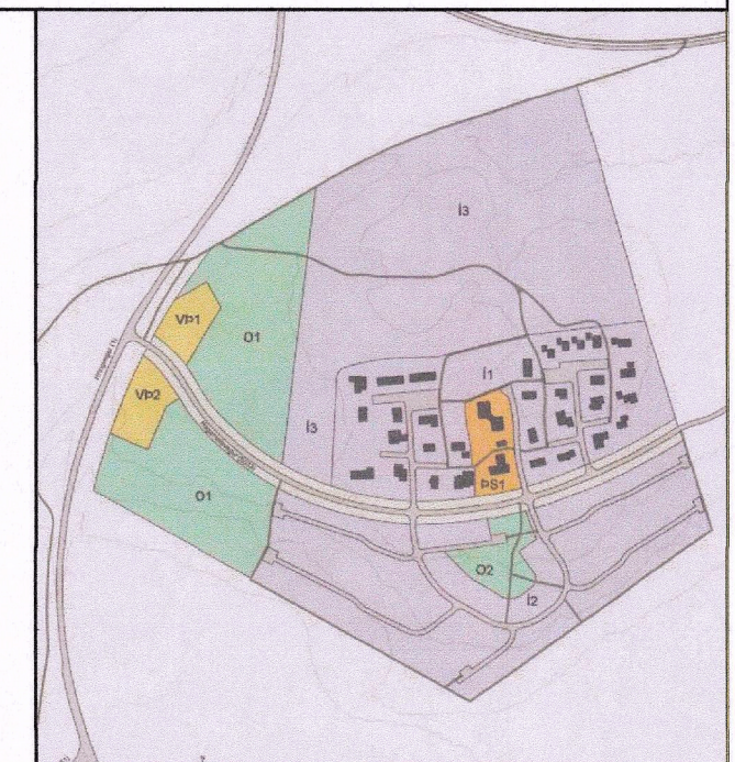
ÚR ADALSKIPULAGI HVALFJARÐARSVEITAR 2008-2020