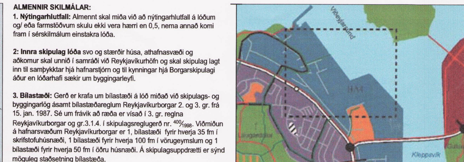
Hluti af Aðalskipulagi Reykjavíkur 2001 - 2024