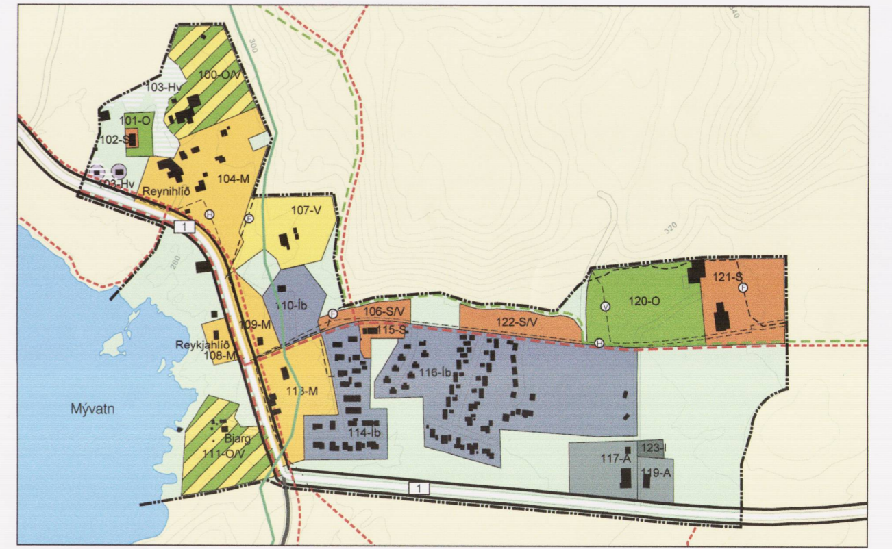
Þéttbýlisuppdráttur, Reykjahlið mkv. 1:10.000