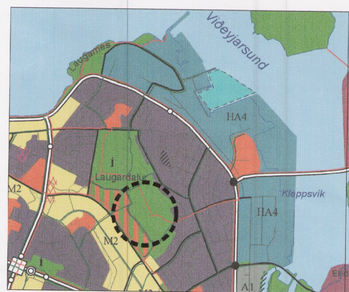
HLUTI AÐALSKIPULAGS REYKJAVÍKUR 2001-2024 STADSETNING SKIPULAGSSVÆDIS