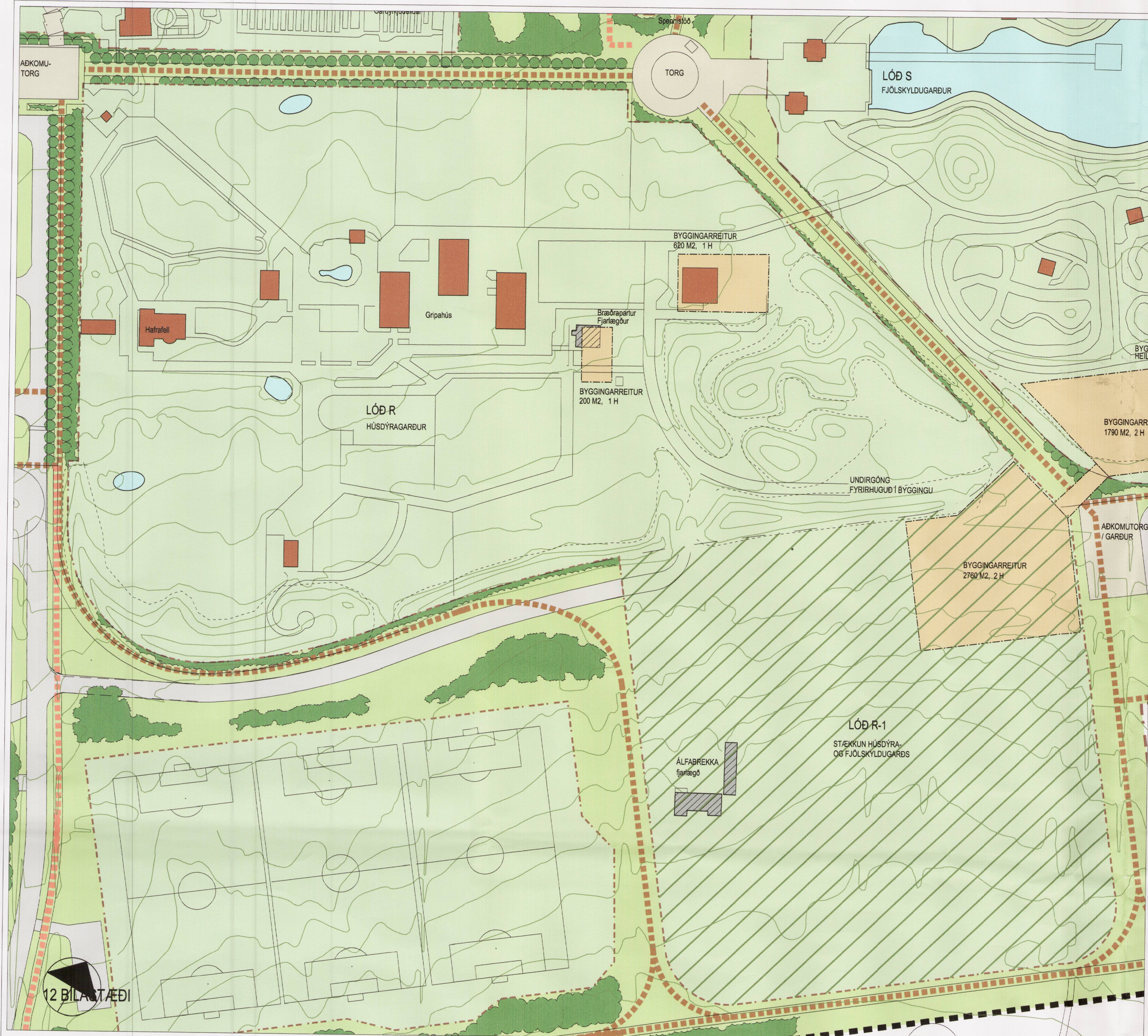
Gildandi deiliskipulag 1:1000 Samþykkt í borgarráði: 13.01.2005