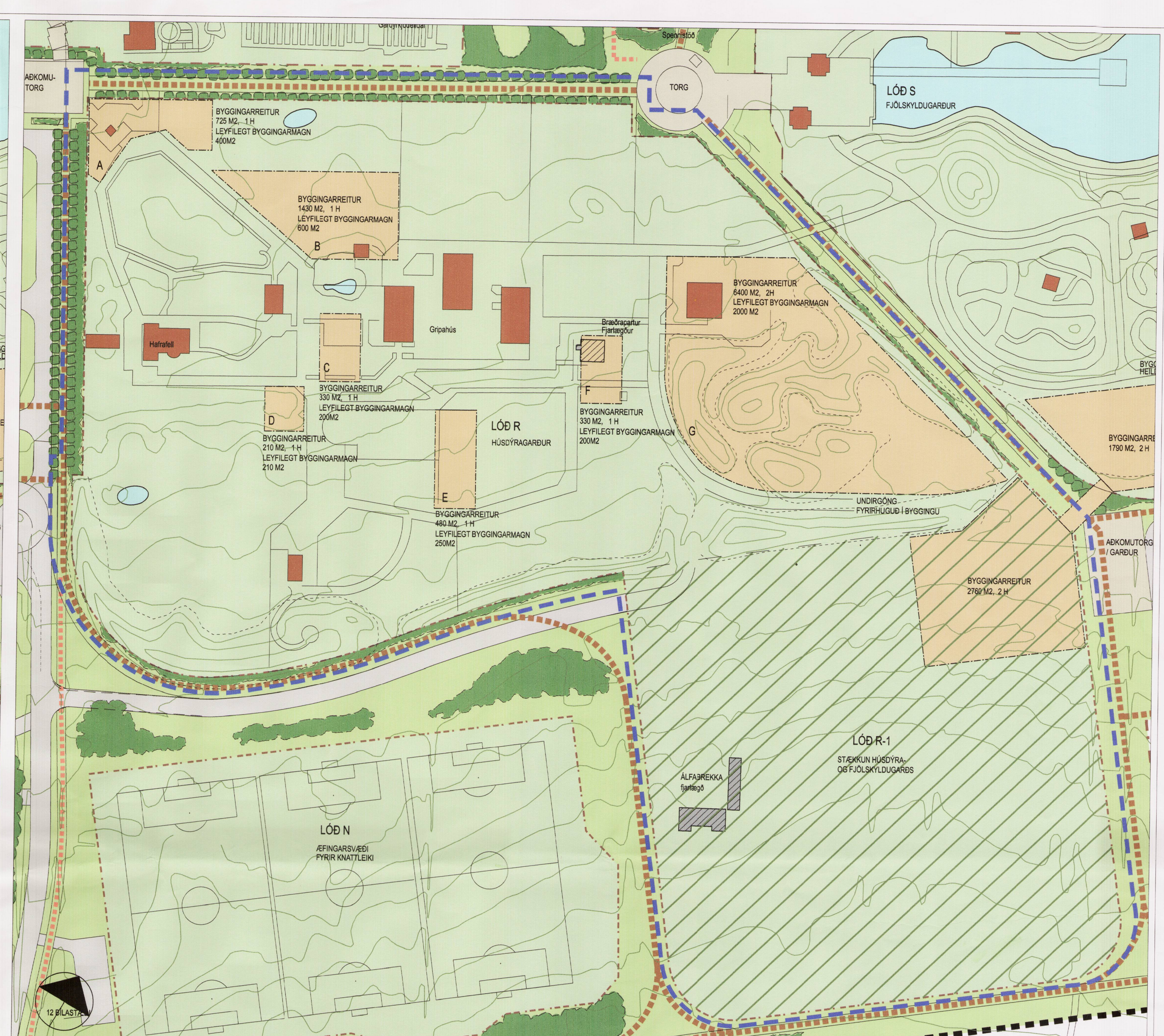
Tillaga að breytingu 1:1000