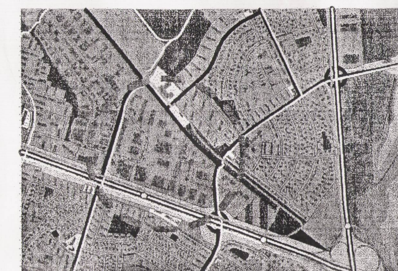
Gildandi aðalskipulag 1996-2016 mælikvarði 1:20 000 (hluti) staðsetning svæðis

Deiliskipulagsbreyting þessi var í kynningu frá 10. apríl 2002 til 10. Júní 2002.