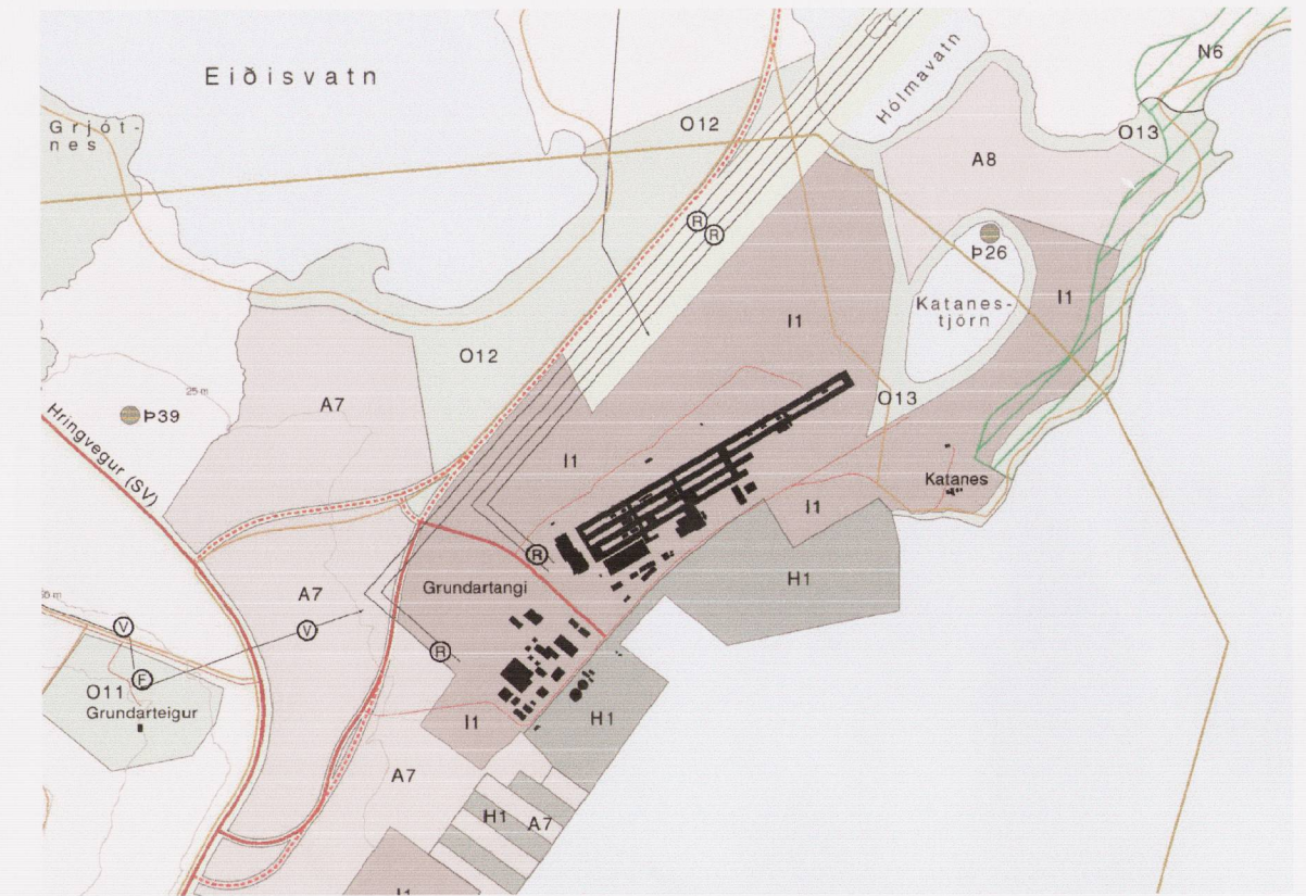
Hluti úr aðalskipulagi Hvalfjarðarsveitar 2008-2020, síðast breytt í mars 2014.