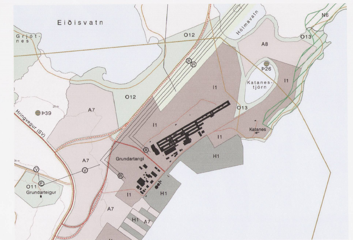
Hluti úr aðalskipulagi Hvalfjarðarsveitar 2008-2020, síðast breytt í mars 2014.