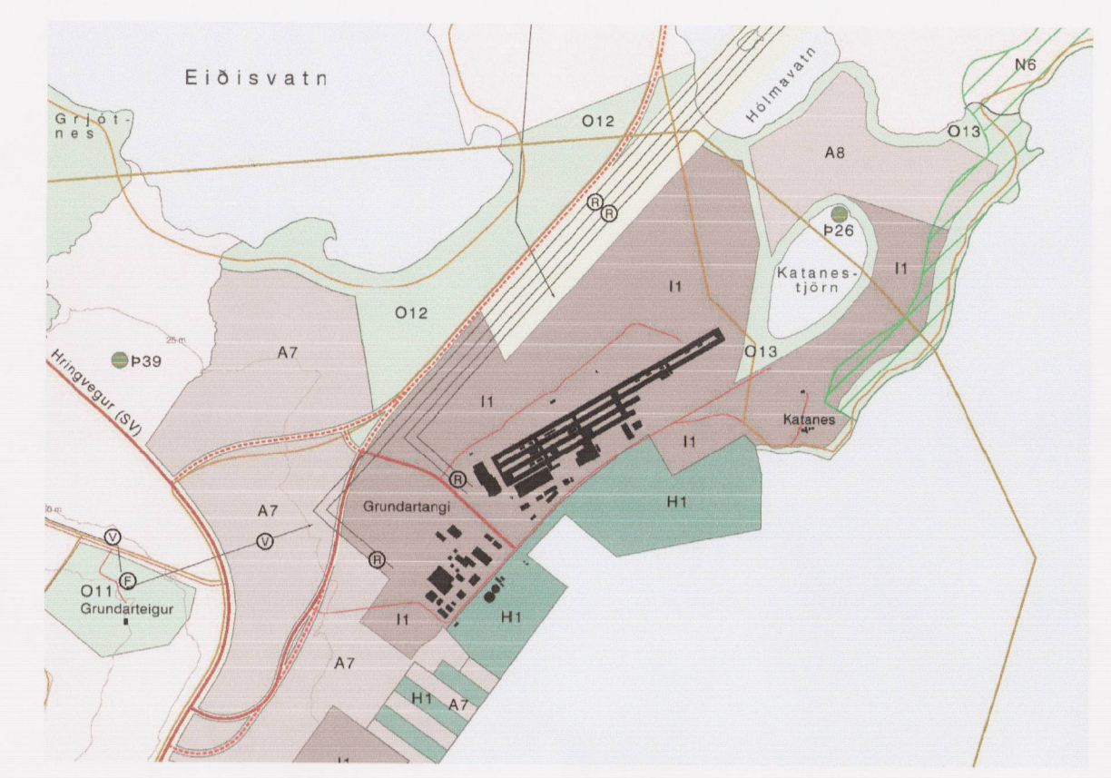
Hluti úr aðalskipulagi Hvalfjarðarsveitar 2008-2020, síðast breytt í mars 2014.