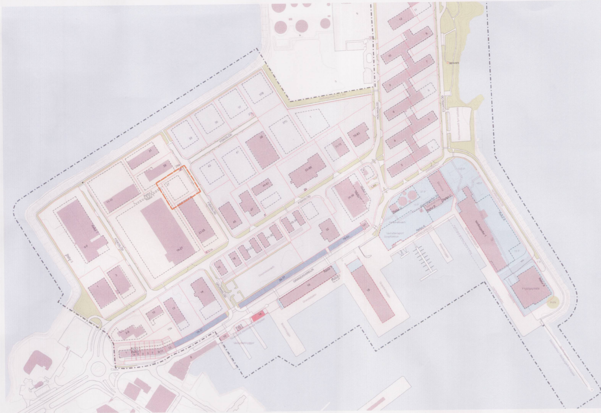
GILDANDI DEILISKIPULAG SAMÞYKKT Í BORGARSTJÓRN 3. NOV. 2015, MEÐ BREYTINGU SAMÞYKKTRI Í UMHVERFIS- OG SKIPULAGSRÁÐI 4. MAÍ 2016 M.1:2000