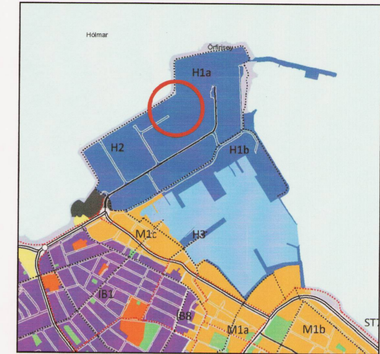
HLUTI AÐALSKIPULAGS REYKJAVÍKUR 2010-2030