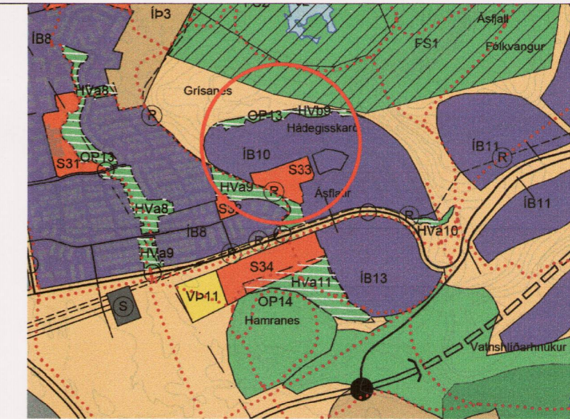
HLUTI AÐALSKIPULAGS HAFNARFJARÐAR 2013-2025 STADSETNING SVÆÐISINS