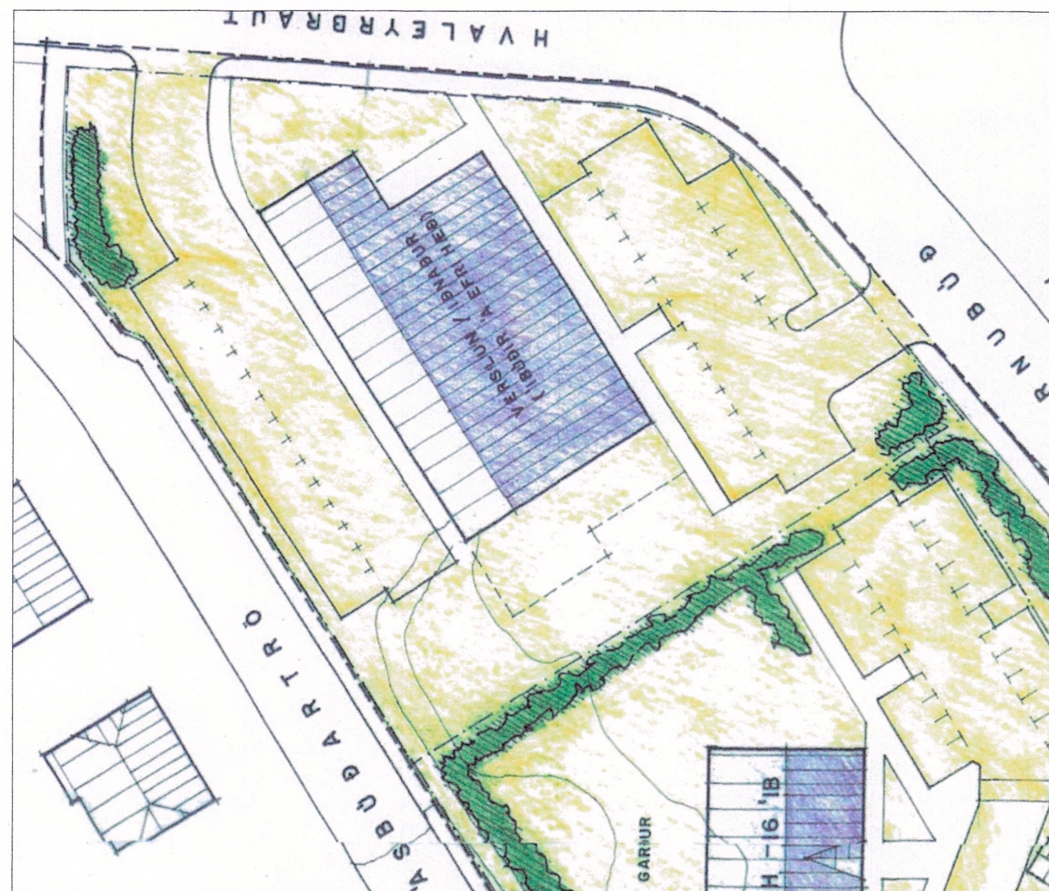
NÚGILDANDI DEILISKIPULAG M-1:500

Núgildandi deiliskipulag lóðarinnar Hvaleyrarbraut 3, var samþykkt í bæjarstjórn Hafnarfjarðar þann 28. des. 1993 og af skipulagsstjóra ríkisins 5. ágúst 1994.