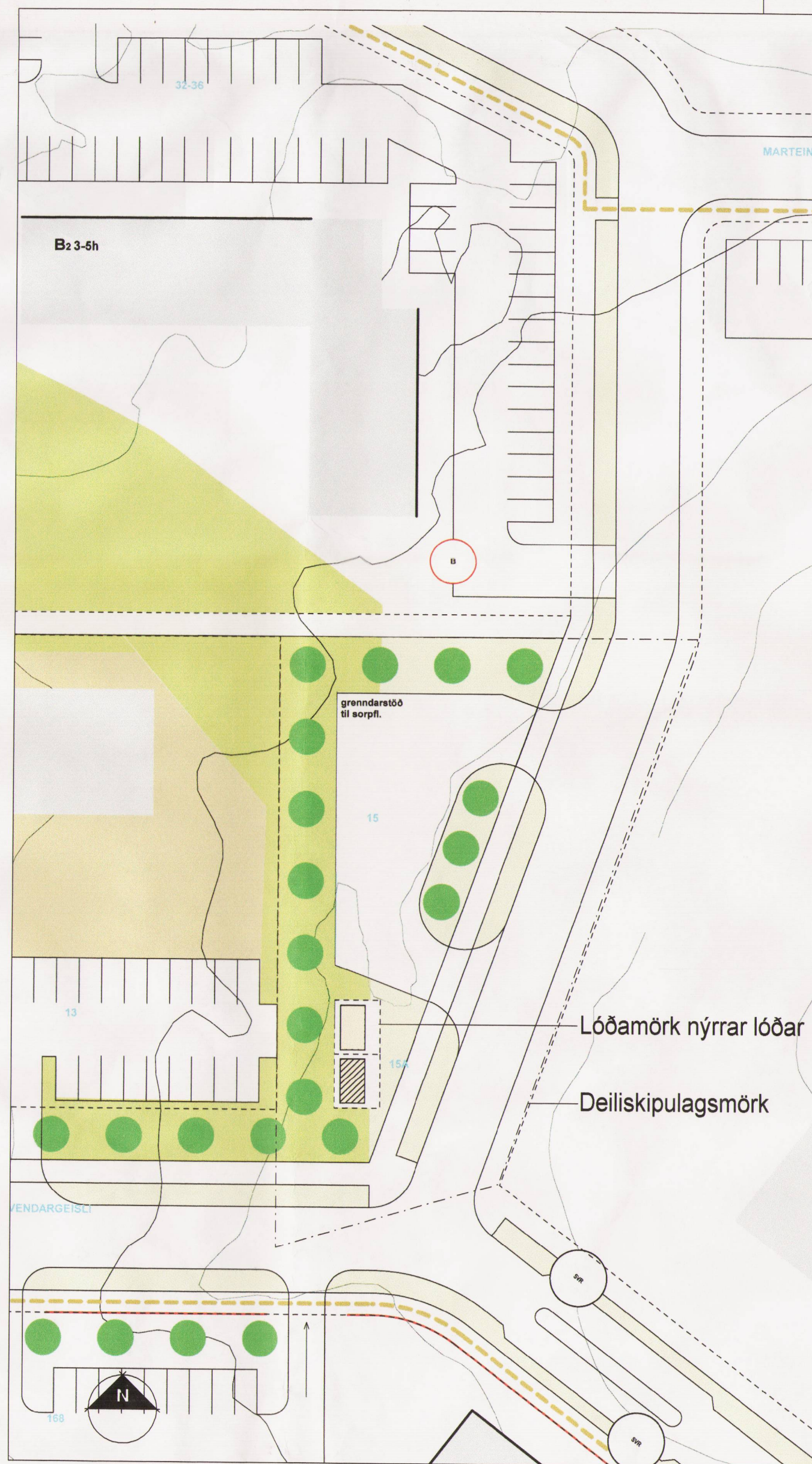
Skýringarmynd fyrir Þórðarsveg 1:500

Greinargerð: Deiliskipulagsbreytingin felst í því að afmarka lóð fyrir sendistöð vegna fjarskiptabúnaðar við hlið lóðar Orkuveitu Reykjavíkur á mótum Þórðarsveigs og Gvendargeisla. Stærð lóðar er 5x5 metrar. Hæð masturs á lóð er 16 metrar