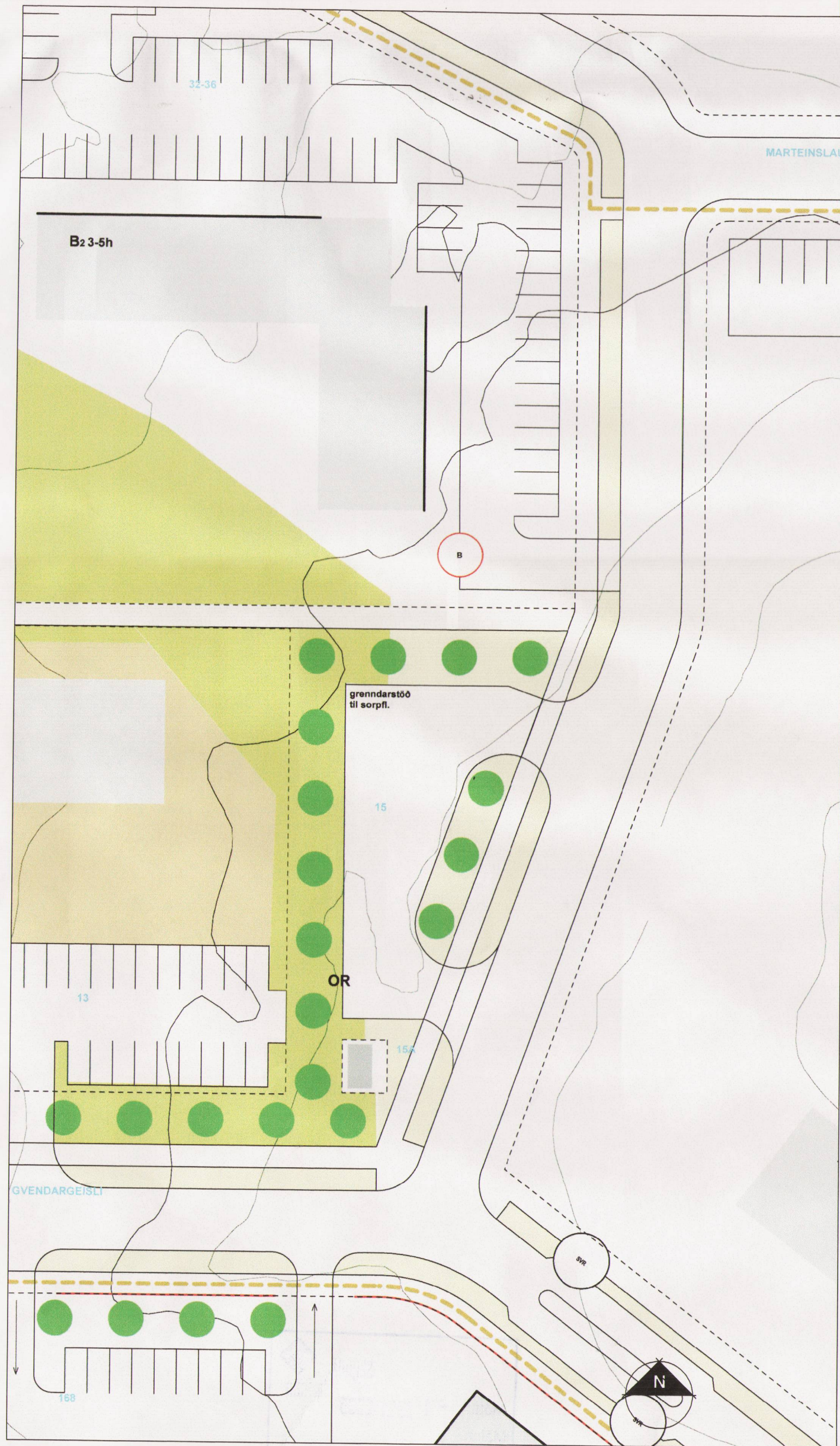
Gildandi deiliskipulag fyrir Þórðarsveg 1:500