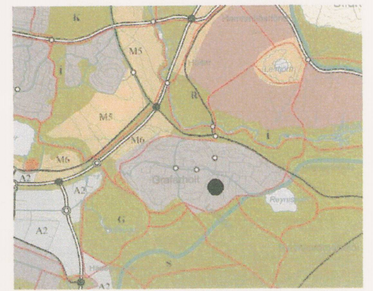
Hluti Aðalskipulags Reykjavíkur 2001-2024

Að öllu öðru leyti gilda samþykktir skilmálar.