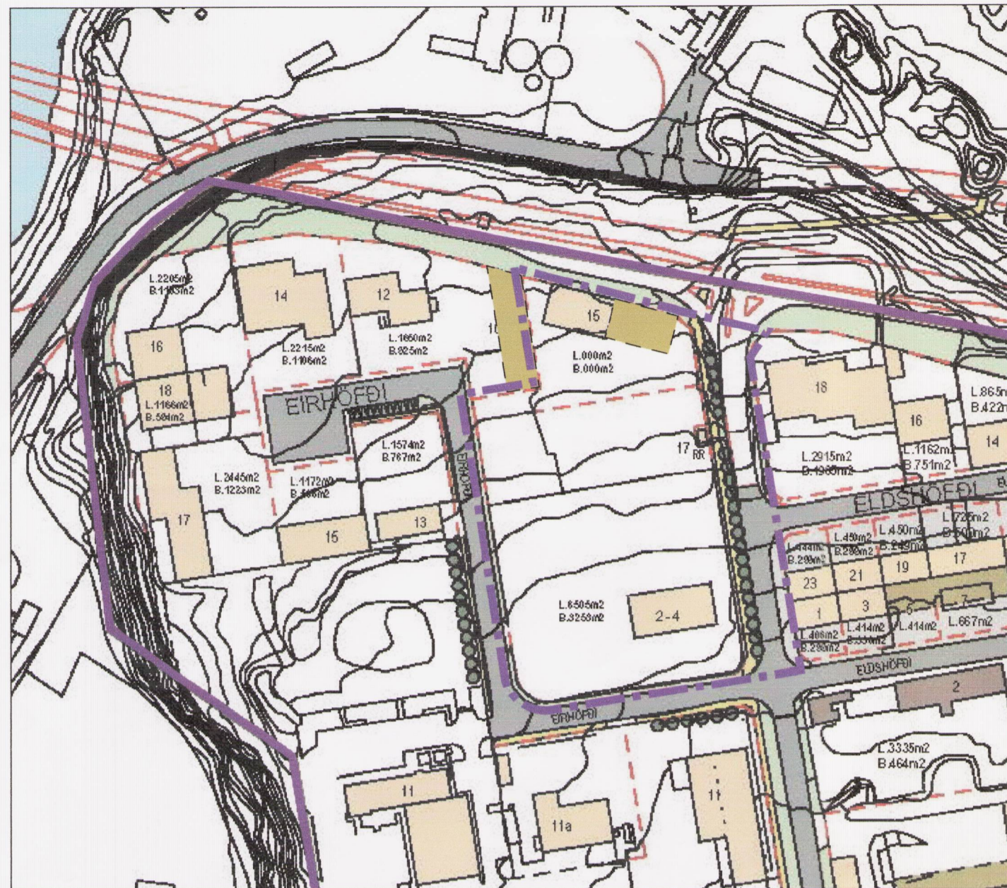
HLUTI GILDANDI DEILISKIPLAGS ÁRTÚNSHÖFÐI - ÍDNÁÐARSVÆÐI Endurskoðun skipulags samþykkt 1 júní 1999 með síðari breytingum mkv 1:2000