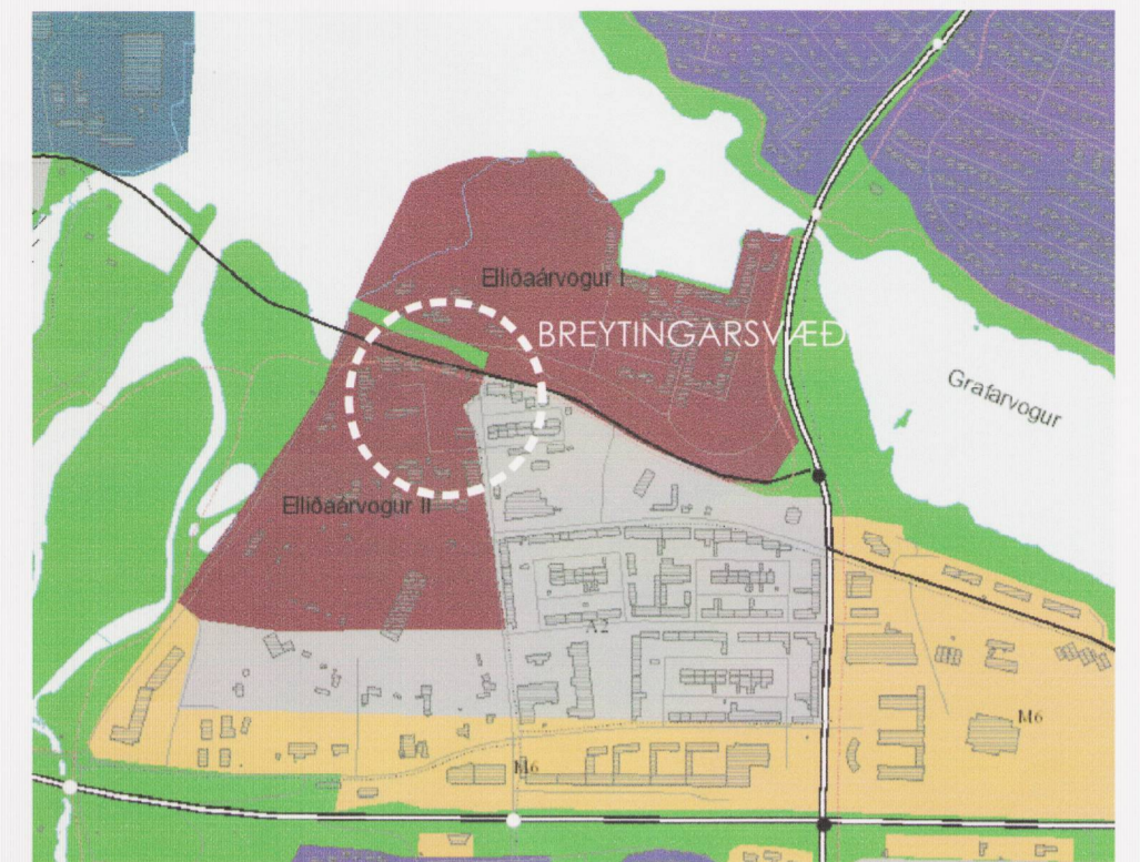
HLUTI AF GILDANDI AÐALSKIPLAGS REYKJAVÍKUR 2001-2024