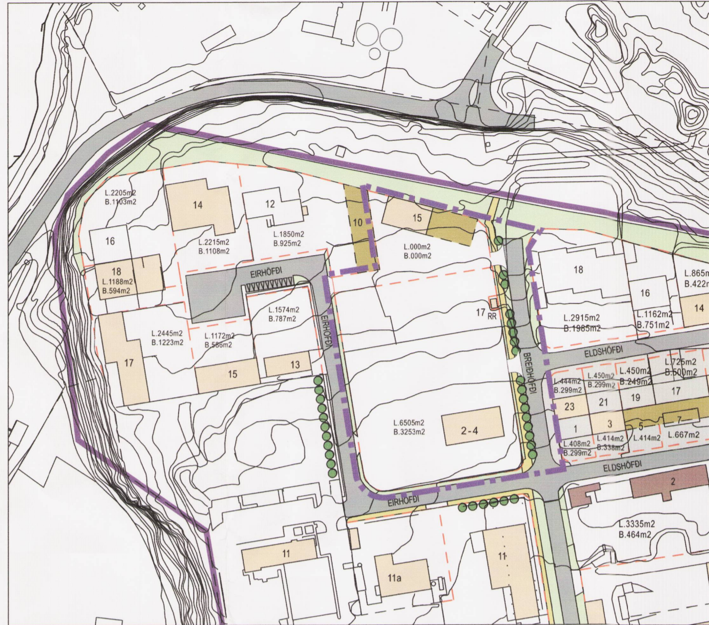
Deiliskiplagsbreyting - Tillaga mkv. 1:2000 25.11.2013